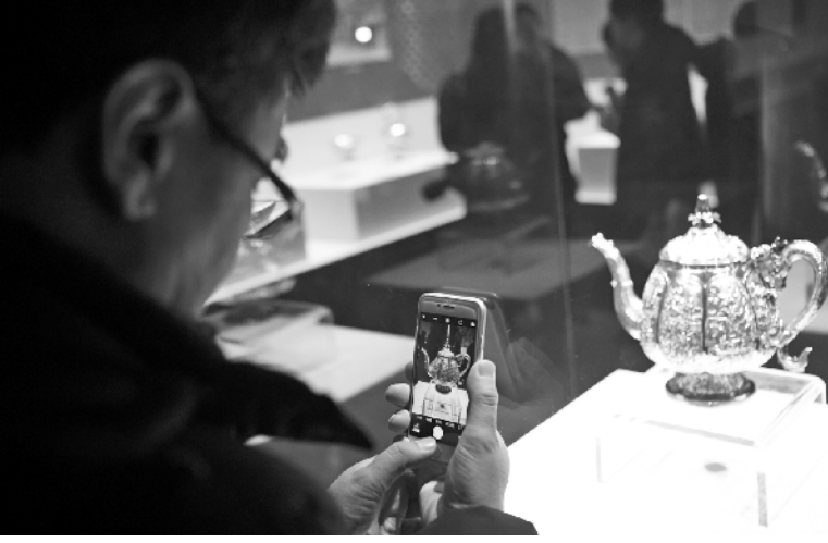
中国外销银器亮相沈阳故宫 2月6日,观众在沈阳故宫“白银时代——中国外销银器特展”上参观。当日,沈阳故宫博物院与长沙博物馆联合主办的“白银时代——中国外销银器特展”在沈阳故宫博物院开展。本次展览分为:“海外华品”“艺脉千年”“意趣相融”三个部分,共展出精品外销银器105件套,精美的展品吸引许多观众前来参观。

加尧姆与现任总统亚明是同父异母兄弟,从1978年开始担任马尔代夫总统,并先后五次连任。他在2013年助力亚明成功当选总统,但亚明执政后兄弟俩反目。目前,加尧姆是马尔代夫反对党联盟的重要领导人。本月1日,马尔代夫最高法院突然发布裁决令,要求亚明及其政府无罪释放前总统纳希德等9名反对派领导人。随后,反对派支持者走上街头游行庆祝,并与警方发生冲突。