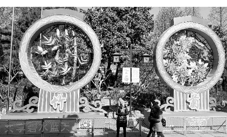
济南:布置花灯迎新年 2月6日,在济南市趵突泉公园内,游客在观看已经布置完成的大型花灯。春节临近,济南市趵突泉公园内布置起花灯准备迎接新年。据悉,2018年趵突泉公园迎春花灯会以“灯灿·泉旺·湖山新”为主题,共有花灯60余组,将在2月16日(大年初一)正式亮灯。 新华社发

一般认为,我国水井最早出现在长江流域新石器文化晚期。距今7000年至6000年前的河姆渡文化遗址内,曾发现带井架的水井遗迹。新发现的6眼水井是河南省文物考古研究院在进行《贾湖及周边相关遗址》课题研究时发现的。这一课题旨在揭示我国新石器时代前期重要遗址——贾湖遗址周边地区人们的生活状态,再现淮河上游八九千年前的辉煌。