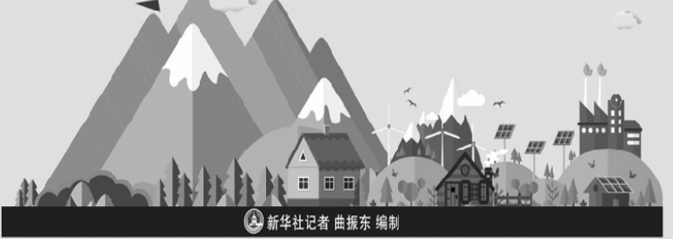
新华社记者 曲振东 绘制