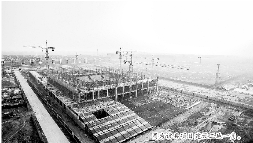
图为该县项目建设工地一角。

郸城项目建设工作呈现出的新气象、新变化、新突破，可谓是亮点纷呈，这些成绩得益于郸城县委、县政府指挥有力、措施得力。该县一是坚持重点项目领导分包制度。每一个重点项目从开工到竣工都责成一名县处级领导主抓，主管部门专门抓，相关部门协助抓，形成上下齐抓共管的良好局面，确保了项