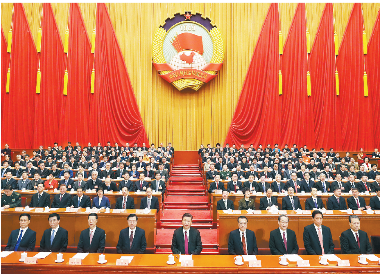
3月15日,中国人民政治协商会议第十三届全国委员会第一次会议在北京闭幕。这是习近平、李克强、张德江、俞正声、张高丽、栗战书、王沪宁、赵乐际、韩正等在主席台就座。

新华社北京3月15日电 中国人民政治协商会议第十三届全国委员会第一次会议在圆满完成各项议程后,15日上午在人民大会堂闭幕。会议号召,人民政协各级组织、各参加单位和广大政协委员,更加紧密地团结在以习近平同志为核心的中共中央周围,以习近平新时代中国特色社会主义思想为指导,同心同德、扎实工作,为决胜全面建成小康社会、夺取新时代中国特色社会主义伟大胜利、实现中华民族伟大复兴的中国梦而努力奋斗。