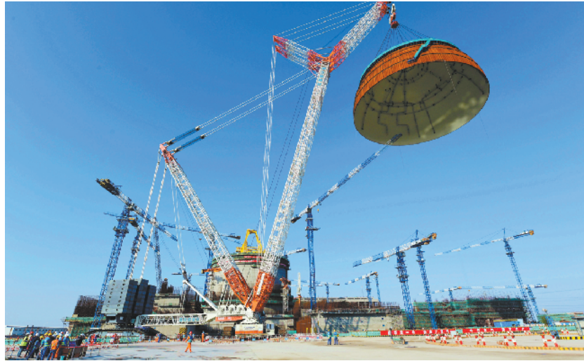
国内第二台“华龙一号”完成穹顶吊装 3 月 21 日,中核集团福清核电 6 号机组反应堆穹顶正在吊装。当日,中核集团福清核电 6 号机组完成反应堆穹顶吊装。这是继 2017 年 5 月福清核电 5 号机组之后,国内第二台完成穹顶吊装的“华龙一号”核电机组。 新华社发

精诚团结、共同奋斗,就没有任何力量能够阻挡中国人民实现梦想的步伐!” 20 日上午,习近平在十三届全国人大一次会议闭幕会上坚定有力的讲话,彰显出伟大中华民族的豪情壮志,发出踏上新征程的动员,凝聚起亿万人民的磅礴力量。 中华巨轮,从这个春天再次启航! ——再启航,旗帜高扬,以习近平同志为核心的党中央举旗定向、掌舵领航。 “习近平主席是咱们全票选出来的人民领袖,听他的话没错。我们不仅要吃饱穿暖住好,还要奔向全面小康,这是光荣而艰巨的任务。只有坚决听党话跟党走,才能打赢这个仗。”89 岁的申纪兰话语洪亮。 人民领袖为人民,光辉思想耀未来。这是,是新时代的中国信心! ——再启航,迎风破浪,誓将坚决打赢三大攻坚战,实现全面小康。 春到贵州,金灿灿的油菜花绽开,蓬勃生机点染大地。全国政协委员、贵州岩博村党委书记余留芬已经在这里和贫困“较劲”17 年。 “从参加党的十九大到这次两会,不仅责任更重,也对如何落实十九大的部署有更深理解。”她相信,只要奋进不停步,通过加强农民素质教育,实施乡村振兴,芬芳一定会遍布偏远山乡。 勇于担当开新局,攻坚克难夺胜利。这是,是新时代的中国决心! ——再启航,挺进深水,将全面深化改革进行到底,为新时代的中国提供不竭动力。 不少代表委员都敏锐地发现,今年的政府工作报告中“改革”成为出现多达 97 次的高频词。 上海浦东新区区长杭迎伟代表表示,“证照分离”改革 2 月份在浦东试点后,下一步还将在 10 个领域 47 项改革中进一步加大改革的力度,在开办企业、贸易通关、不动产登记等方面跑出“自贸区速度”。 紧抓历史机遇期,将改革进行到底。这是,是新时代的中国恒心! ——再启航,和衷共济,以更加昂扬的姿态和一往无前的勇气,开启实现中华民族伟大复兴的新征程。 一年前的春天,井冈山市正式宣布在全国率先脱贫摘帽。 “脱贫摘帽只是中考,全面小康才是大考。开完这次两会,加满了油、鼓足了劲,回去要带大家走好‘新的长征’!”江西省吉安市市长王少玄代表说。 时空流转,精神力量在新时代薪火相传,伟大民族精神历久弥新。 亲历伟大变革,投身伟大时代。这,就是不变的初心! 风雨无阻,高歌行进。以 2018 年两会为新的起点,从生机盎然的春天出发,在以习近平同志为核心的党中央坚强领导下,中华巨轮风帆高扬,驶向光辉的胜利彼岸! (新华社北京 3 月 20 日电)