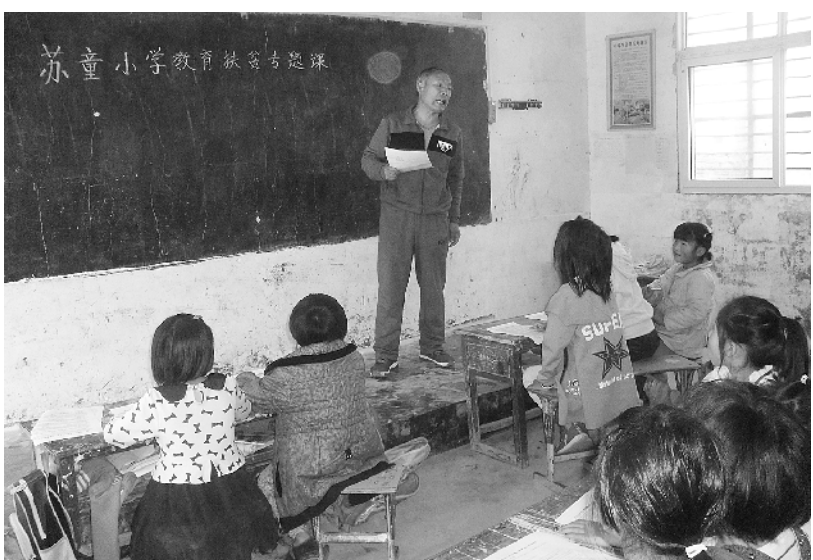
近日,商水县教育体育局组织城乡学校开设教育扶贫专题课,向广大师生发放《商水县教育体育局教育扶贫资助政策明白卡》,使教育扶贫政策家喻户晓、深入人心。图为4月中旬,该县魏集镇苏童小学教育扶贫专题课现场。

此次活动,让孩子们更深刻理解了经典故事,同时呼吁家长和孩子多读书,读好书,让孩子们喜欢阅读经典故事,让孩子的童年充满书香。