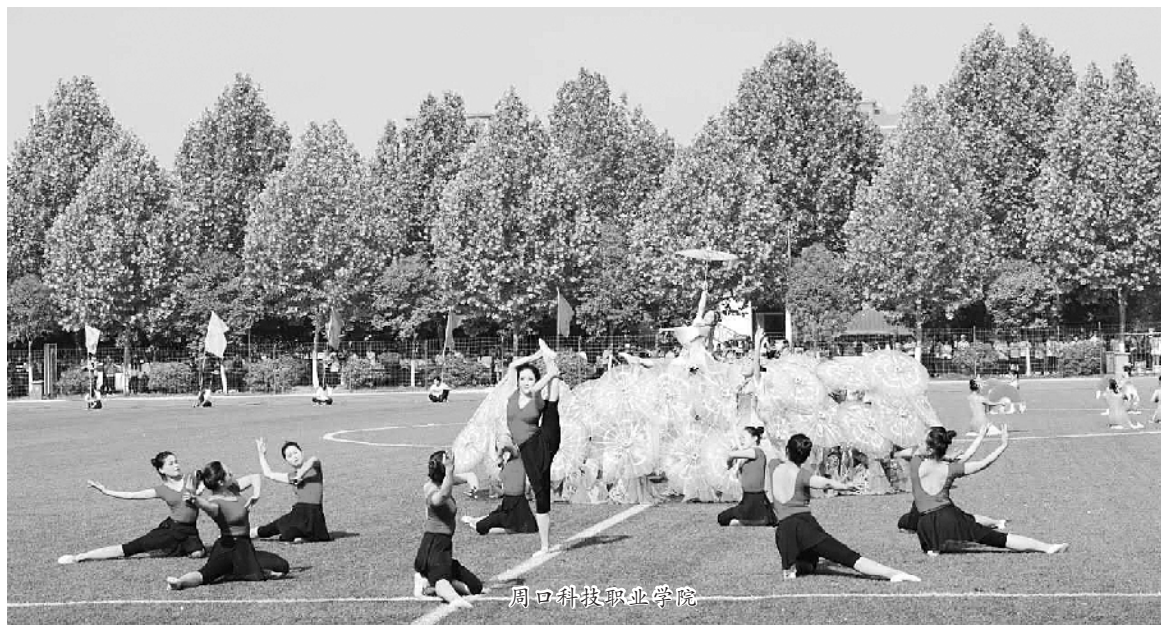
周口科技职业学院

周口市文昌中学本着“文明其精神,野蛮其体魄”运动精神,每年举行两届运动会。本届运动会是该校第五届校园艺术节的内容之一,该校在总结以往经验的基础上,立足校园运动事业,坚持体育育人,充分展现了文昌学子锻炼自己、展现自己的青春风采。