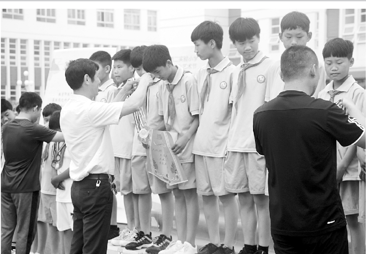
5月18日上午,郸城县第二实验小学全体师生欢聚操场,隆重举行首届文化艺术节闭幕式暨颁奖典礼。本届艺术节的举办为广大师生提供了一个自我展示的平台,也是学校开展素质教育成果的汇报,更多的是给学生一次体验,让他们在参与中体验,在体验中成长。

据悉,此次消防安全大检查增强了师生消防安全意识,提高了师生自救能力,排除了校园消防安全隐患,奠定了校园安全基础。