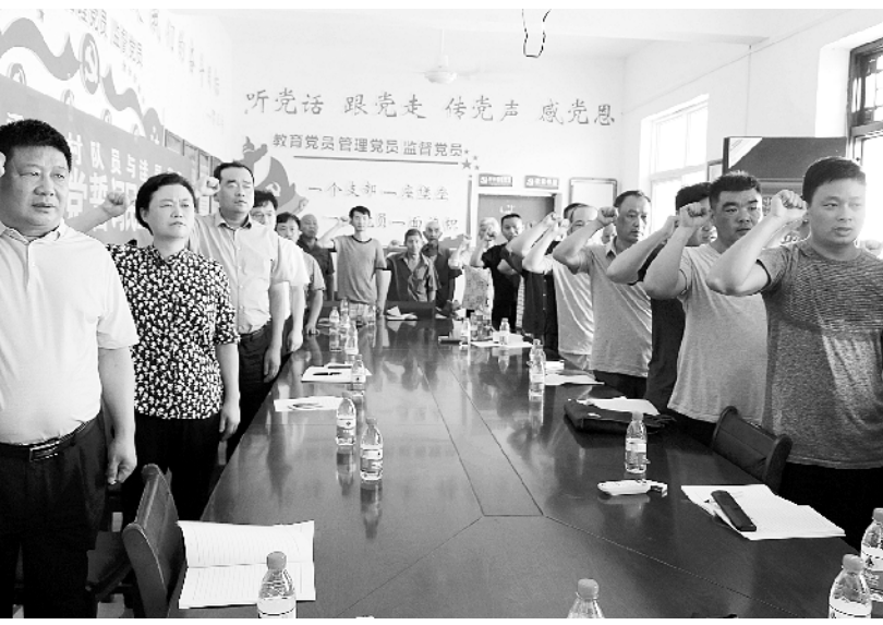
6月25日,郸城县纪委开展“时刻听党话、永远跟党走”为主题的“迎七一”重温入党誓词活动,向党的 97 岁生日献礼。大家纷纷表示,作为共产党员,要不断强化宗旨意识,坚定理想信念,在各自的工作岗位上充分发挥模范带头作用,坚决做一名忠诚、干净、担当的纪检监察干部。图为活动现场。

调查核实情况: 该窑厂全称是淮阳县齐老牧工商发展有限公司,位于齐老乡齐老村北 1 公里,法人齐学海,生产非粘土烧结砖。2016 年在清理整改违法违规建设项目中,进行了环境影响现状评估,并在淮阳县环保局网站进行备案公示。按照现状评估要求,该企业以煤矸石和粘土按照一定比例生产非粘土砖。2018 年 6 月 12 日,针对其脱硫脱硝、在线监控系统运行不达标现象,淮阳县污染防治攻坚战领导小组办公室对齐老乡和县供电公司下达了《淮阳县污染防治攻坚战领导小组办公室关于加强砖瓦行业管理的通知》,6 月 13 日齐老乡电管所切断了该企业动力电源,齐老乡政府督促该企业进行停产整改。淮阳县环保局对其违法行为进行了立案处罚,并分别下达了责令改正违法行为通知书、行政处罚事先告知书。现场检查时,发现该企业自 2018 年 6 月 13 日停产整改,没有生产,不存在冒黑烟现象,检查时物料全部进行了覆盖,但是场区部分路面未进行硬化,群众反映问题部分属实。 处理整改情况: 针对该企业存在的问题,调查组要求立即对厂区路面进行全面硬化。目前该企业正在停产整改,场地已全部硬化完毕,待企业写出开工生产申请报告,经验收达到百分之百要求,脱硫脱硝设施、在线监测运行正常,达标排放后,方可正式恢复生产。下一步将责成有关单位根据各自职责,对其加大监管力度,使其脱硫脱硝及在线监控设施达标运行,确保污染物稳定达标排放。同时建立健全长效管理机制,组织相关部门定期开展砖瓦行业联合执法,坚决杜绝类似事件再次发生。 问责情况: 经研究,给予齐老乡齐老行政村党支部书记、网格员齐征善党内警告处分,给予齐老乡环境保护管理所负责人申强诫勉谈话处分。