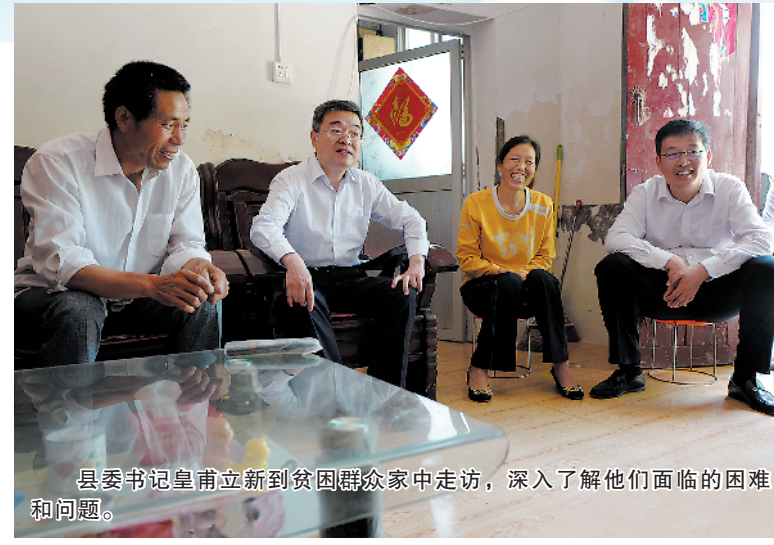
县委书记李晋奎到贫困户家中走访,深入了解他们面临的困难和问题。