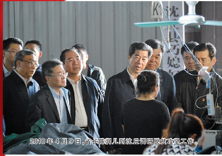
2018年4月9日,省长刘宁、书记李晋奎、省长刘宁、书记李晋奎、省长刘宁、书记李晋奎...