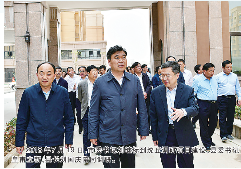
2018年7月19日,中宣部副部长、中央书记处书记、中宣部常务副部长、中宣部副部长、中宣部副部长...