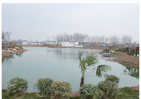
沈丘县大力实施“六村共建”,开展“美丽乡村”建设,取得了良好成效。图为白集镇刘楼行政村由垃圾围村变得风景宜人。