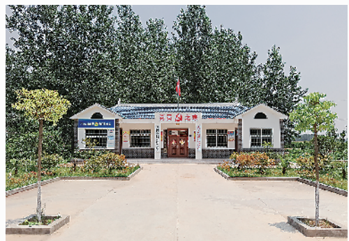
沈丘县不断夯实在基层的执政基础,着力提升组织力,助推基层党建全面发展。图为下路口镇肖门行政村干净整洁的党员之家。