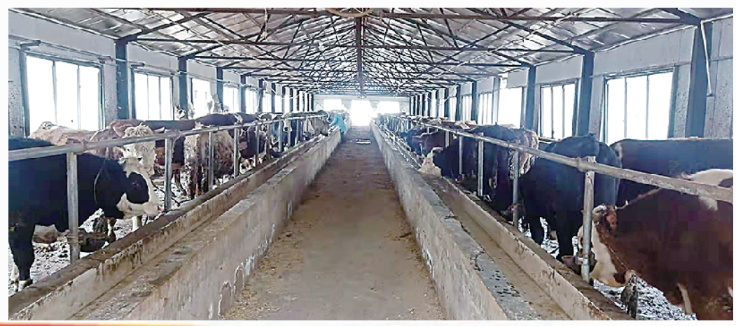
沈丘县大力发展现代畜牧业,提升畜牧业发展的科技含量。图为沈丘县马营镇肉牛养殖专业合作社的牛舍,合作社带动带动养殖户78户贫困户脱贫致富。