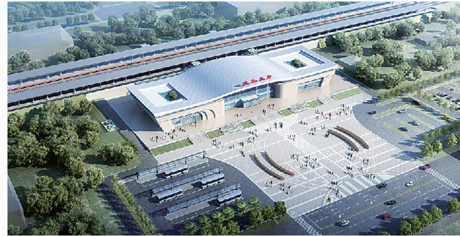
郑合高铁的建设,进一步加强了沈丘和外界的联系,当地党委和政府为高铁建设贡献了力量。图为郑合高铁沈丘北站站房效果图。