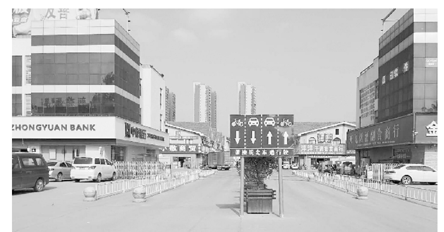
干净整洁的黄淮市场

市场电子显示屏、横幅、标语全方位宣传,营造“创卫”宣传氛围。市场管理分区、分片、分户落实责任,做好商户宣传工作,开展文明劝导活动,确保市场每一家商户都