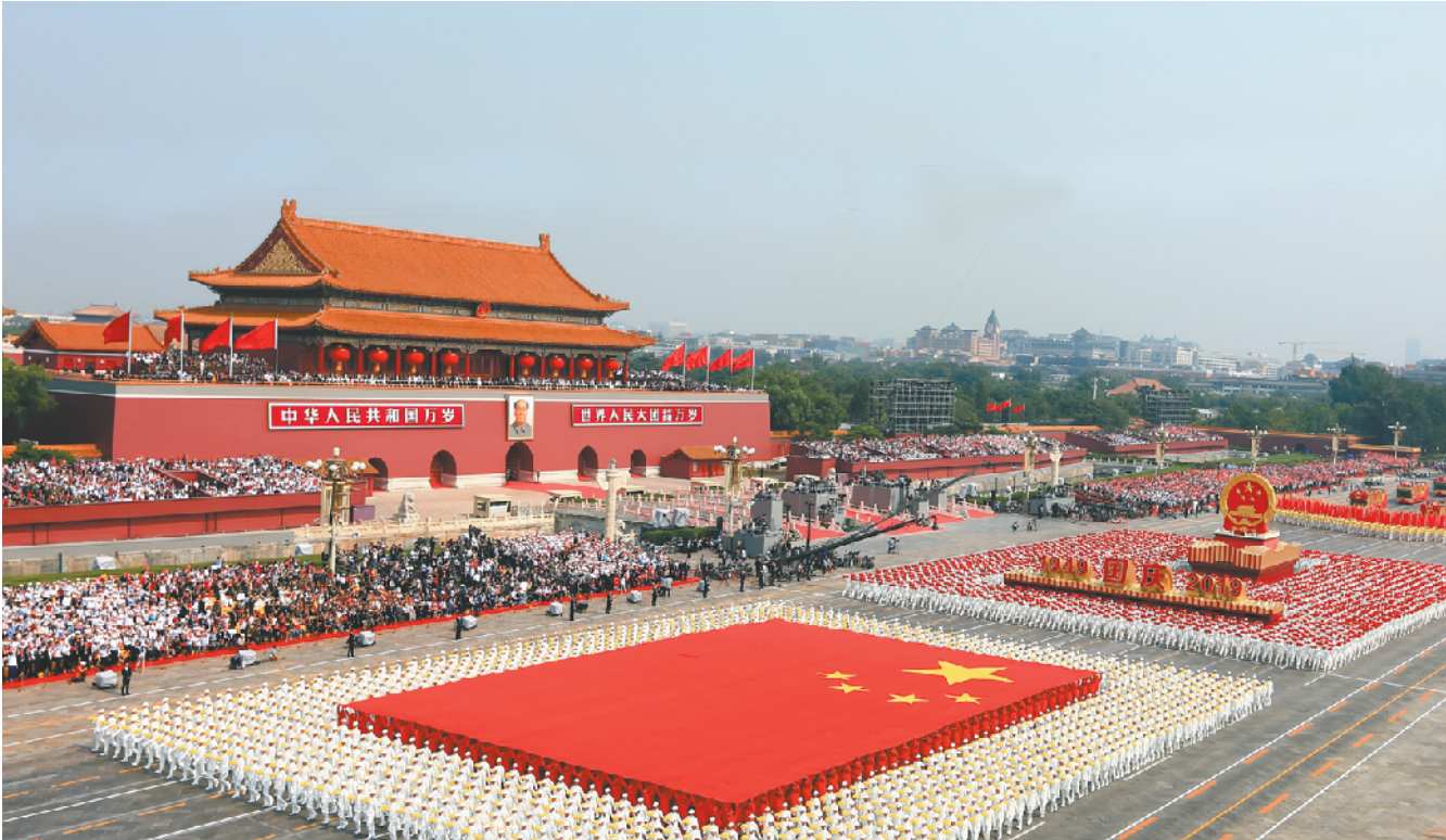
10月1日上午,庆祝中华人民共和国成立70周年大会在北京天安门广场隆重举行。这是群众游行。

全国同胞们， 同志们，朋友们： 今天，我们隆重集会，庆祝中华人民共和国成立70周年。此时此刻，全国各族人民、海内外中华儿女，都怀着无比喜悦的心情，都为我们伟大的祖国感到自豪，都为我们伟大的祖国衷心祝福。 在这里，我代表党中央、全国人大、国务院、全国政协和中央军委，向一切为民族独立和人民解放、国家富强和人民幸福建立了不朽功勋的革命先辈和烈士们，表示深切的怀念！向全国各族人民和海内外爱国同胞，致以热烈的祝贺！向关心和支持中国发展的各国朋友，表示衷心的感谢！ 70年前的今天，毛泽东同志在这里向世界庄严宣告了中华人民共和国的成立，中国人民从此站起来了。这一伟大事件，彻底改变了近代以后100多年中国积贫积弱、受人欺凌的悲惨命运，中华民族走上了实现伟大复兴的壮阔道路。 70年来，全国各族人民同心同德、艰苦奋斗，取得了令世界刮目相看的伟大成就。今天，社会主义中国巍然屹立在世界东方，没有任何力量能够撼动我们伟大祖国的地位，没有任何力量能够阻挡中国人民和中华民族的前进步伐。 同志们，朋友们！ 前进征程上，我们要坚持中国共产党领导，坚持人民主体地位，坚持中国特色社会主义道路，全面贯彻执行党的基本理论、基本路线、基本方略，不断满足人民对美好生活的向往，不断创造新的历史伟业。 前进征程上，我们要坚持“和平统一、一国两制”的方针，保持香港、澳门长期繁荣稳定，推动海峡两岸关系和平发展，团结全体中华儿女，继续为实现祖国完全统一而奋斗。 前进征程上，我们要坚持和平发展道路，奉行互利共赢的开放战略，继续同世界各国人民一道推动共建人类命运共同体。 中国人民解放军和人民武装警察部队要永葆人民军队性质、宗旨、本色，坚决维护国家主权、安全、发展利益，坚决维护世界和平。 同志们，朋友们！ 中国的昨天已经写在人类的史册上，中国的今天正在亿万人民手中创造，中国的明天必将更加美好。全党全军全国各族人民要更加紧密地团结起来，不忘初心，牢记使命，继续把我们的人民共和国巩固好、发展好，继续为实现“两个一百年”奋斗目标、实现中华民族伟大复兴的中国梦而努力奋斗！ 伟大的中华人民共和国万岁！ 伟大的中国共产党万岁！ 伟大的中国人民万岁！ (新华社北京10月1日电)