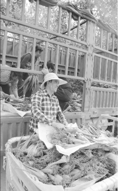
外地种植户前来采购芦荟苗,芦荟种植户喜笑颜开。

荟一筹莫展。葛湾与庞庄村种植的芦荟,是芦荟属中少数可食用的品种之一,其制品被广泛应用于食品、美容、保健、医药等领域。在当地建起芦荟深加工企业,或者有更多采购商前来收购芦荟,成了种植户最深切的期盼。②3