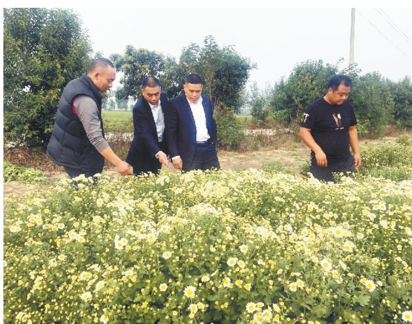
鹿邑农商银行工作人员为农户送资金、送技术、送信息，为秋收秋播洒下“及时雨”。