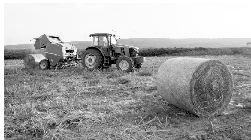
宁夏海原:科学种植谷飘香 在宁夏海原县贾塘乡王塘村,打包机正在谷田里进行作业(10月29日摄)。宁夏回族自治区中卫市海原县正值谷物收获时节,旱作谷田内一片繁忙的丰收景象。海原县地处宁夏中南部干旱带,通过引进渗水地膜及波浪式覆膜种植技术,当地农户在科技特派员的帮扶指导下,获得了良好的种植效益,在干旱的黄土上实现了“藏粮于技”。