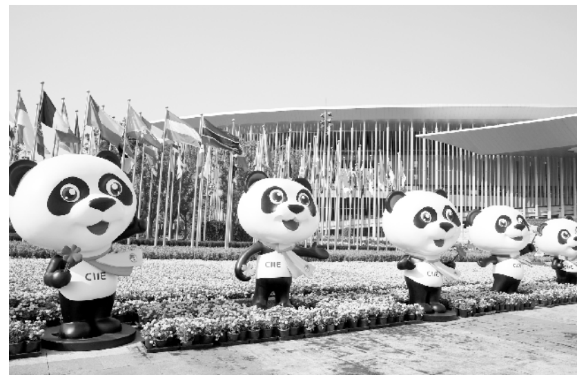
上海国展中心“内外兼修”迎接进博会 10月30日,一排进博会吉祥物熊猫“进宝”在国家会展中心(上海)南广场安放到位。近日,第二届中国国际进口博览会布展工作在国家会展中心(上海)全面展开。从场馆外部装饰到展馆内部展台搭建和大型展品安装调试,有“四叶草”之称的国家会展中心(上海)“内外兼修”迎接进博会的到来。

字金融良好实践、标准和经验的传播运用,为发展中国家和新兴市场数字金融发展提供技术援助支持,推动数字金融更好、更安全地造福世界各国人民,为世界各国搭建一个兼具开放性、包容性和多样性的数字金融领域知识共享与能力建设平台。