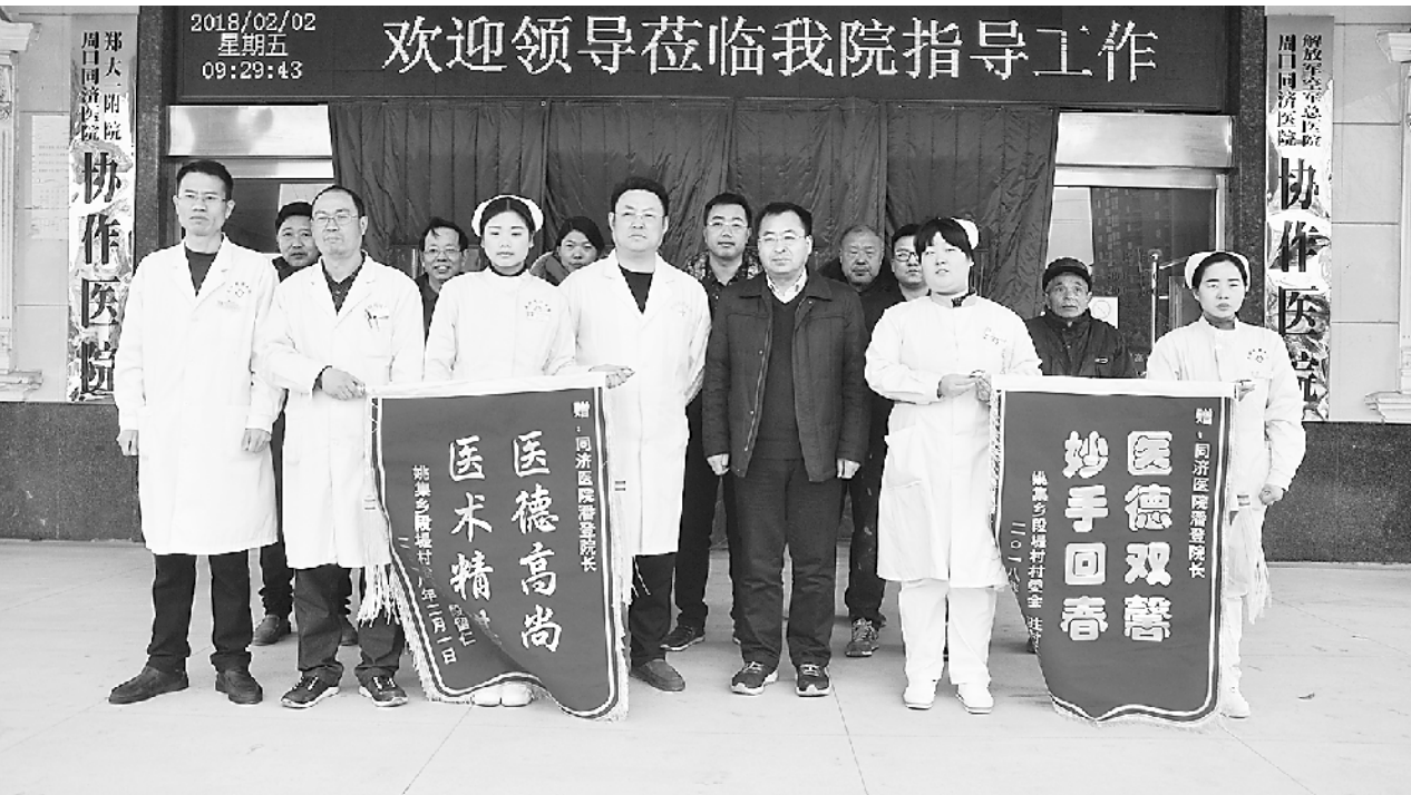
姚集镇段堤行政村村委会向周口人合医院赠送锦旗

户80户、502人。范庄行政村辖1个自然村,有1825人、1802亩耕地,党员26人,“两委”班子健全,有贫困户34户、144人。该院结合实际,立足行业特点,发挥自身优势,开展精准扶贫工作,为520名困难群众建立健康信息档案,多渠道为困难群众办实事,取得了一定成效。