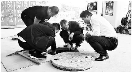
扶沟专项行动期间进行隐患排查。

扶沟县自8月深入开展“防风险、除隐患、保平安、迎大庆”专项行动(以下简称专项行动)以来,对安全生产重视程度高,对隐患排查治理出手重,紧紧围绕省、市有关工作要求,在确保该县安全生产形势持续平稳的前提下,有力促进了扶沟应急管理机构改革向纵深发展。