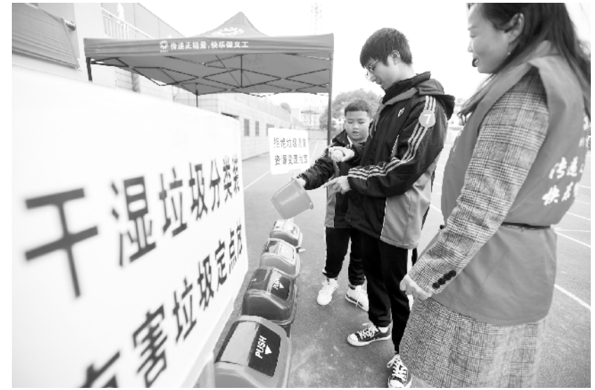
垃圾分类净校园 11月21日,长沙市第六中学学生参加垃圾分类投放游戏。当日,湖南省长沙市第六中学联合长沙市快乐义工协会开展垃圾分类环保宣传月活动,通过讲解演示和现场小游戏等形式,让同学们深入了解垃圾分类的益处和方法,提倡绿色生活,净化校园环境。