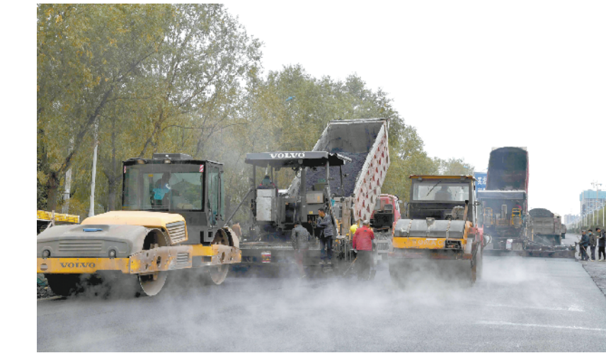
昨日，在中原路（庆丰街至建设大道段）提升改造工程施工现场，工人们正驾驶工程车紧张工作。据悉，该工程距离完工已进入倒计时阶段，庆丰街至文昌大道之间的路面已铺设完毕，目前正在为最北端文昌大道至建设大道之间的路面铺设沥青混凝土，很快就能通车。

本报讯（记者 付永奇 通讯员 李文涛 姜东坡）“不忘初心、牢记使命”主题教育开展以来，商水农商银行党委班子成员围绕广大群众关注的贷款问题，按照“四到四访”要求，深入走访调研，“一竿子插到底”，真正掌握了第一手材料。