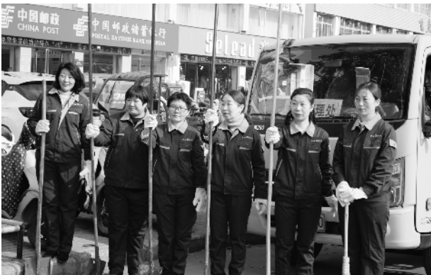
南阳市市政管理处“三八女子疏浚班”