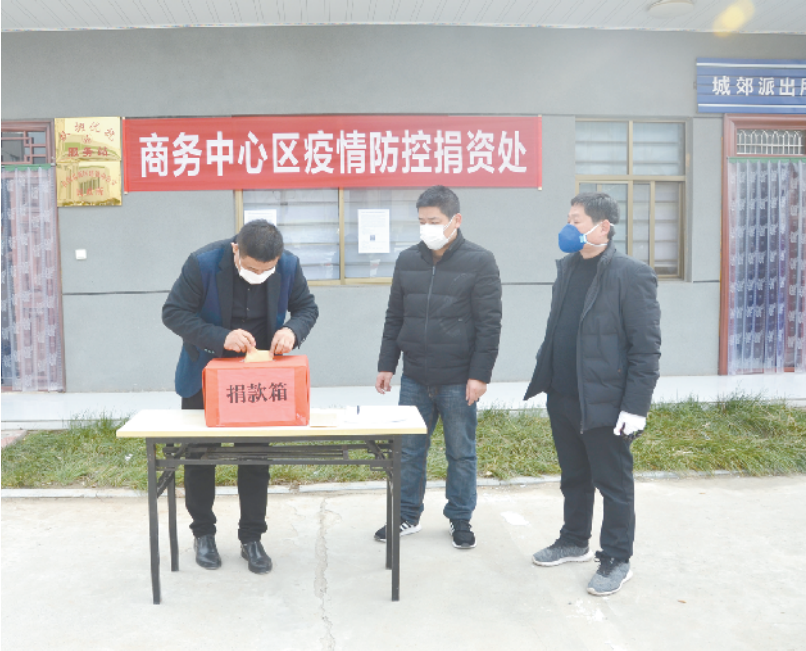
商务中心区工作人员为疫情防控捐款。记者 李一 摄

爱心如潮，让扶沟更有“温度”；爱心涌动，凝聚了阻击疫情的强大合力，让我们更有信心、更有斗志打赢这场疫情防控阻击战。②7