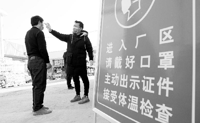
做好防控 有序复工

在保障运力方面，河南省创新实施AB通行证政策，持证车辆“不停车、不检查、不收费、优先便捷通行”。截至目前，河南省累计发放A证10749张，跨省运输各类应急物资37.7万吨，运送医护及防控人员274人；B证发放由初期的6500张增加到13400张，共运送3.9万趟次，运送省内各类物资51.7万吨。下一步，A证将在省内放开使用，按照“一车一证、一次一证、车证一致”的原则，进一步简化申领程序；B证进一步扩大使用范围，相关厅局可直接向省疫情防控交通運輸保障工作组专班提出申请，鼓励其他健康无害物资运输车辆无证正常运行。