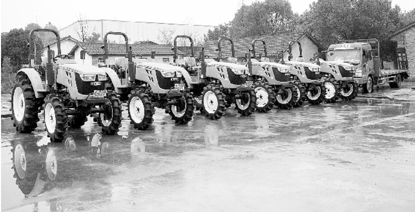
湖南常德：推出“共享农机”服务 不误农时

截至1月末，地方政府债券剩余平均年限5.2年，其中一般债券4.9年，专项债券5.6年；平均利率3.54%，其中一般债券3.54%，专项债券3.53%。