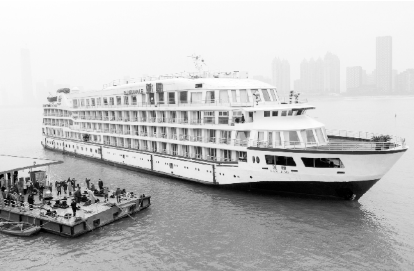
首艘支援武汉的“蓝鲸”号游轮抵达武汉

“随着疫情形势变化，各地陆续出台支持企业复工营业相关政策，便利店等经营居民生活必需品企业的开业率还将进一步提高。百货店、购物中心等大型商场也将陆续恢复营业。”郑文说，商务部将持续关注企业开业情况，根据疫情发展需要，进一步做好指导和服务工作。需要特别强调的是，各地在指导企业复工的同时，要督促企业做好疫情防控，建立严格的岗位责任制，避免复工后出现聚集性感染事件。