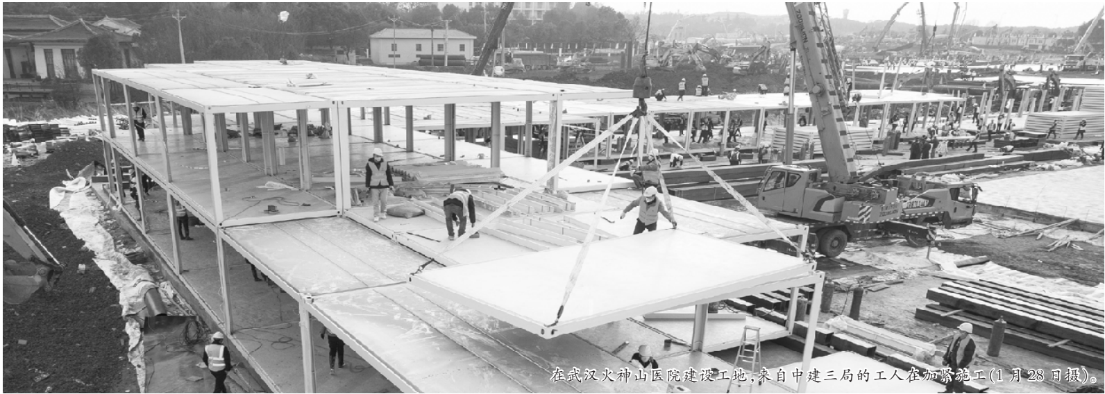
在武汉火神山医院建设工地，来自中建三局的工人在加紧施工(1月28日报)。