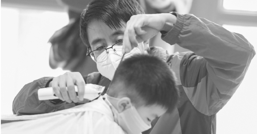
爱心“义剪”暖社区 2 月 25 日，在长沙八方社区睦邻居家养老服务中心，理发师为一名小朋友理发。当日，为满足疫情期间居民的理发需要，湖南长沙望岳街道八方社区联合一家理发店为社区居民提供爱心“义剪”，服务对象为 60 周岁以上的老年人，12 周岁以下的未成年人以及社区、物业工作人员。

河、大厂、香河等环京 6 个区县通过“一信、一卡、一证”等方式，方便通勤人员出行，保障出入便利；积极推动环京周边地区实现通勤人员 14 天隔离政策统一标准、政策互认；协调天津市针对进京大人流和通勤人员专门采取相关措施加强疫情防控。同时，推动奔驰、小米、京东方等在津冀的供应链配套企业复工复产，把统筹推进疫情防控和经济社会发展各项工作抓实抓细抓落地，实现疫情防控和协同发展工作“两不误”。