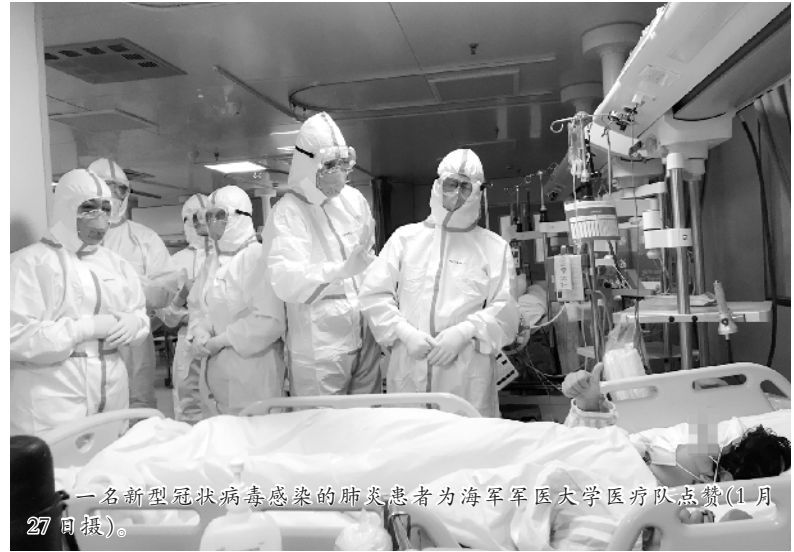
一名新型冠状病毒感染的肺炎患者为海军军医大学医疗队点赞(1月27日报)。