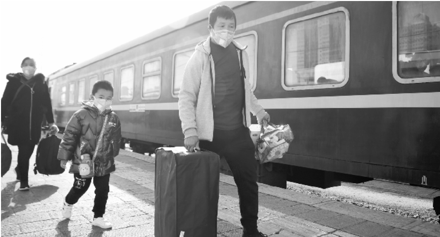
中国铁路兰州局集团恢复开行 16 对旅客列车 2 月 25 日，旅客在兰州火车站站台准备乘车。2 月 24 日起，中国铁路兰州局集团有限公司陆续恢复开行兰州至上海、武威、张掖等方向的 16 对旅客列车，满足复工复产旅客运输的需要。铁路部门提醒旅客及时关注列车时刻信息，乘坐火车出行时佩戴好口罩，确保出行安全。

号为 3U8085，周二当地时间 13 时 55 分从成都起飞，19 时到达东京；周五当地时间 13 时 30 分从成都起飞，19 时到达东京。回程航班号为 3U8086，周二当地时间 20 时 30 分从东京起飞，次日 2 时 15 分到达成都；周五当地时间 20 时 30 分从东京起飞，次日 1 时 45 分到达成都。