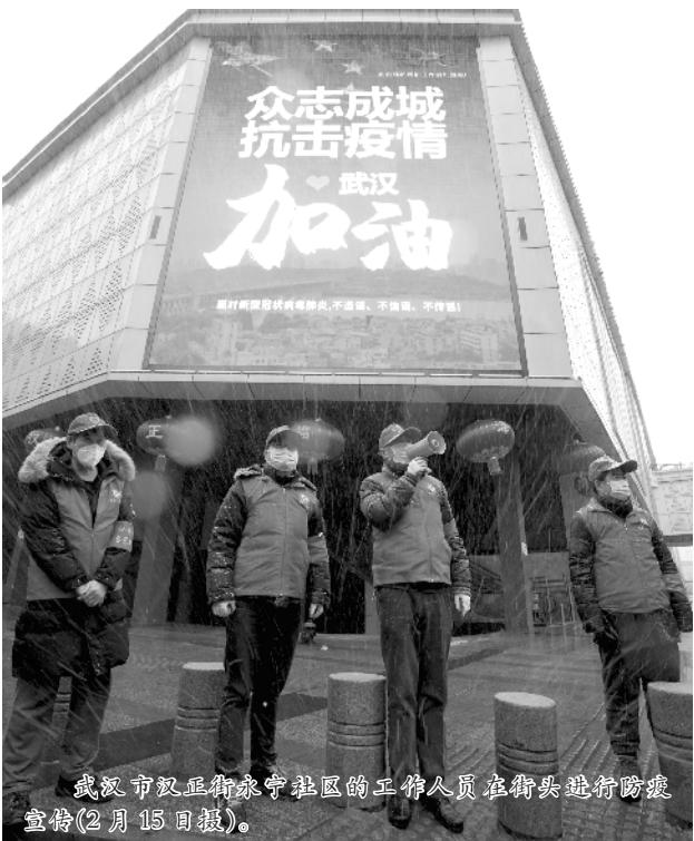
武汉市汉正街永丰社区的工作人员在街头进行防疫宣传(2月15日报)。