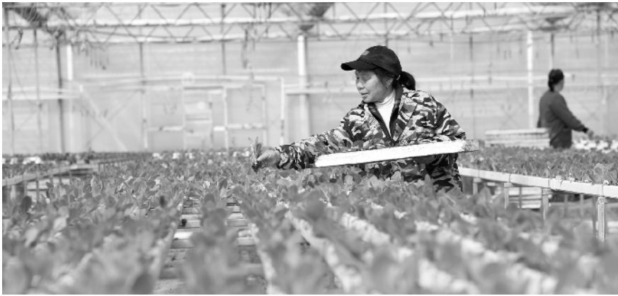
初春农事忙 2 月 25 日，在江西省宜春市袁州区西村镇东升有机蔬菜基地，村民栽种生菜。初春时节，气温回升，各地农民在田间地头忙于农业生产。

通知还指出，加大对区内企业信用培育，统筹关区认证资源，对申请高级认证企业的区内企业，加快认证进程，帮助更多区内企业成为海关“经认证的经营者”(AEO)企业；在区内大力推动“互联网+保税”监管，区内企业向海关申请注册登记、备案或变更的，海关实行网上办理。