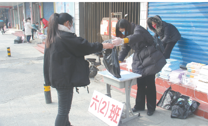
周口市七一路二小以班级为单位,错时领取新学期教材。