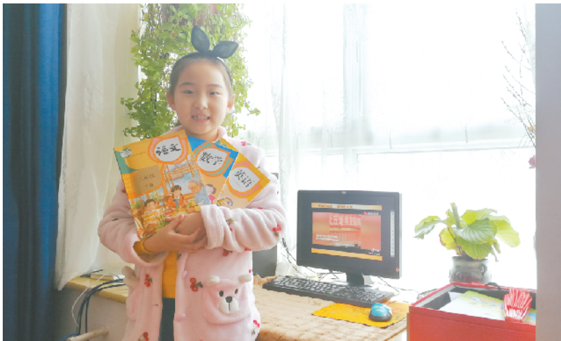
周口市文昌小学学生喜领新学期教材。