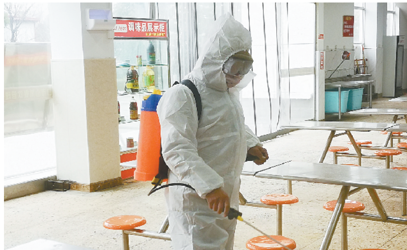
周口一高工作人员“全副武装”对食堂进行消毒。

本报讯 (记者 王珂 文/图)新冠肺炎疫情发生以来,全市教育系统牢固树立“疫情就是命令,防疫就是责任”的工作思路,把广大师生的生命安全和身体健康放在首位,对校园进行全方位消杀,竭力为师生提供安全、卫生的工作和学习环境。②10