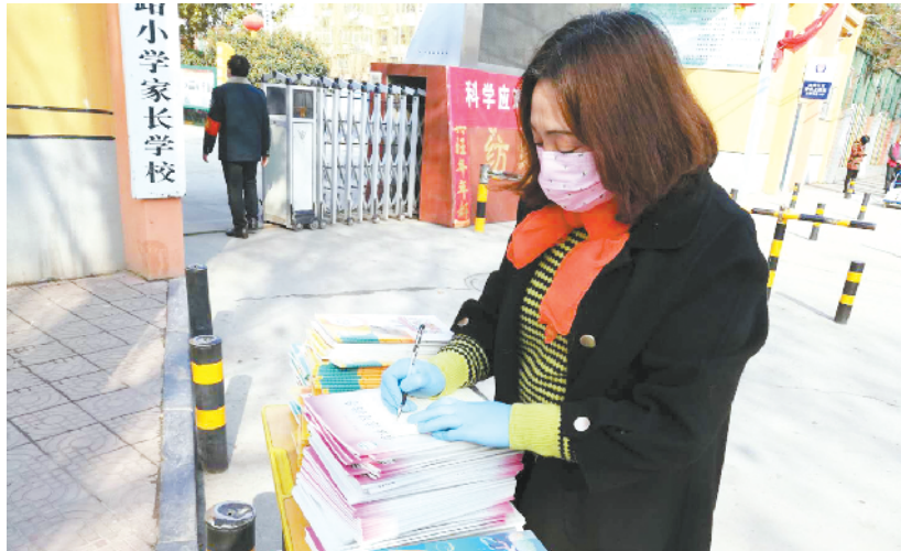
周口市纺织路小学教师在校外领书点做新学期教材登记工作。