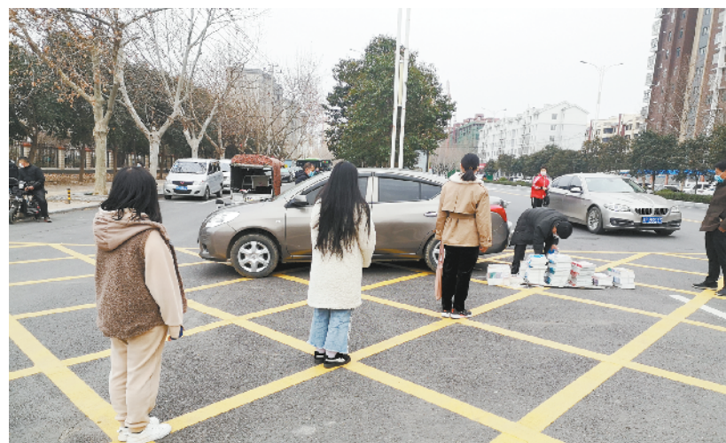
周口市第十初级中学学生家长在指定位置排队,有序领取新学期教材。

本报讯 (记者 刘华志 关秋丽 文/图)“学校安排很到位,孩子的学业在疫情期间也不会耽误,非常感谢你们!”3月2日下午,几名七一路二小一年级学生家长间隔一米有序排队,领到用塑料袋包裹的新书后说。疫情防控期间,为积极回应广大师生及家长对教材教辅的期盼,解决学生教材使用问题,进一步提升线上教学效果,按照省教育厅通知要求,我市各中小学陆续发放新学期教材。②10