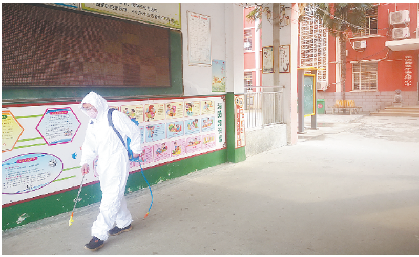
周口四中工作人员对校园主通道进行消毒。