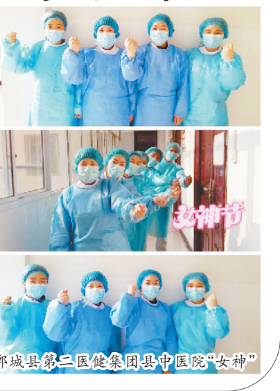
郟城县第三医健集团县中医院“女神”

徐松 张洋 汗水浸透了衣裳 勒痕印满了脸庞 无惧生死 战场奔忙 我不知道她来自哪里 甚至看不清她的模样 只知道是天使将我们守护 美丽又善良 像妈妈一样满含慈祥 是她带来温暖,带来力量 是她把寒夜照亮 是她将生命延长 她是逆行的天使 祝最美的她妇女节快乐