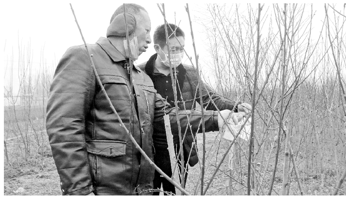
抓好春耕生产督查工作

规定,只能做退回处理。经了解,该企业为辖区内1家骨干民营企业,受疫情影响,企业资金较为紧张。该行本着“特事特办”的原则,积极与财政局协商,在确定使用正确的功能分类科目后,决定先拨款,再让财政部门报送正确的票据,以解企业的燃眉之急。①6