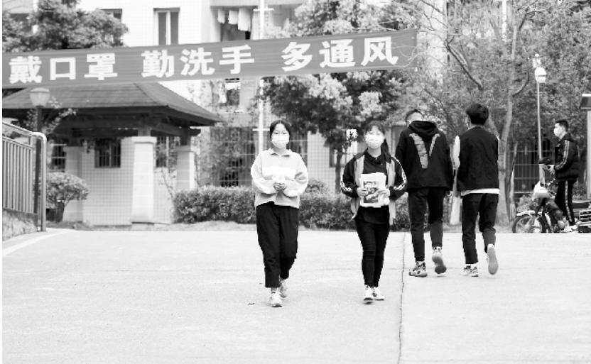
四川高三学生开学复课 4 月 1 日，四川省蓬安县第二中学高三学生正有序进入教室上课。当日，四川省高三年级学生开学复课。

此外，澳门特区政府之前推出的其他民生措施也已开始实施，包括居民住宅水电费豁免及补贴措施，以纾解防疫期间的水电费用开支；临时性向每名永久性居民多发一次 600 元的医疗券；对社工局经济援助的弱势家庭多发 2 个月的援助金等。