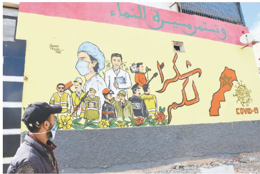
摩洛哥:感谢为抗击疫情辛苦付出的人们

目前,中老铁路多个车站的信号楼及通信铁塔基础施工稳步开展,隧道漏缆钻孔作业同步进行。