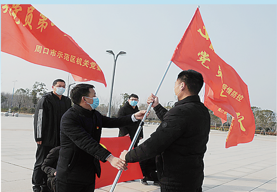
党员先锋队授旗仪式。