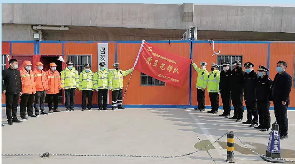
党员先锋队一线执勤。