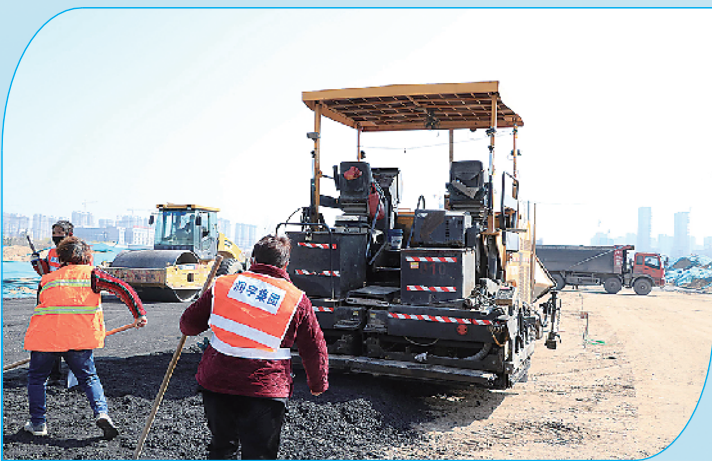
庆丰路东延项目施工现场。

关键时刻的重要部署,是责任的担当,是力量的彰显,更是守初心、担使命的具体体现。示范区广大党员干部放弃节假日,坚守岗位、靠前指挥,坚持24小时值班,始终战斗在疫情防控一线。