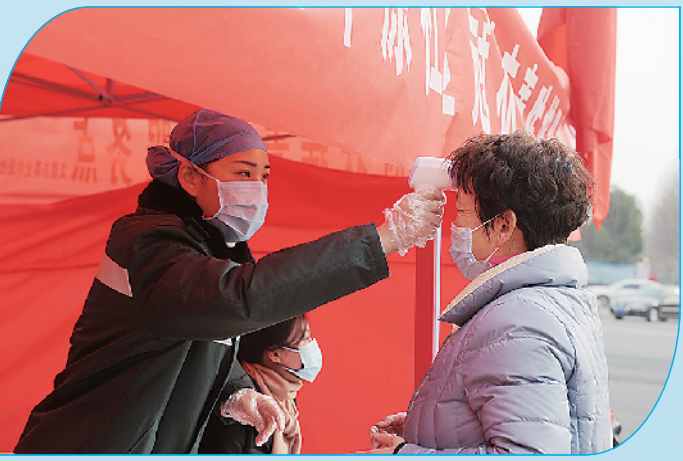
社区防控人员在为居民测量体温。