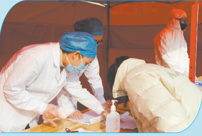
中原社区防控卡点工作人员为居民登记信息。