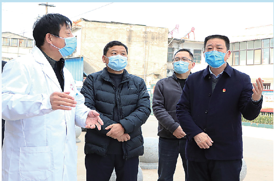
示范区党工委副书记立即超一线督导疫情防控工作。