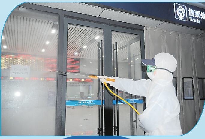
爱心人士为周口高铁东站员工消毒。