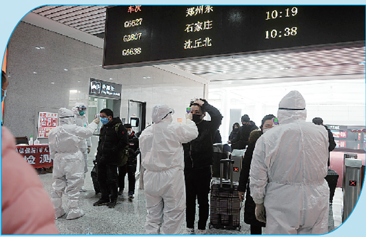
高铁周口东站医护人员为乘客测量体温。

鲜红的党旗用血染红,庄严的党徽熠熠生辉。 在战“疫”的前哨阵地,“我是党员,我先上”成为示范区党员干部最响亮的呼声。哪里任务险重,哪里就有党组织坚强有力的领导,哪里就有党员当先锋做表率的身影。正是这些党员干部,他们践行着初心、显示着担当。