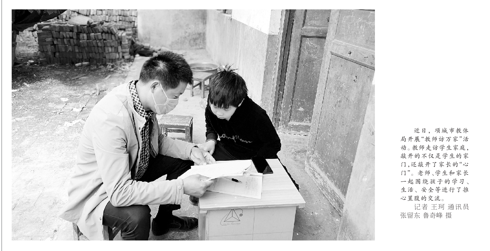
近日,项城市教体局开展“教师访万家”活动。教师走访学生家庭,敲开的不仅是学生的家门,还敲开了家长的“心门”。老师、学生和家长们一起围绕孩子的学习、生活、安全等进行了推心置腹的交流。

从严治党的责任,持之以恒抓好党的政治建设、作风建设、基层基础建设、廉政建设、监督体系建设、党建责任落实六大重点工作。 会议号召,学院党员干部要在习近平新时代中国特色社会主义思想的指导下,不忘初心、牢记使命,只争朝夕、不负韶华,以永远在路上的执着、一刻不松懈的坚韧,持续推动全面从严治党向纵深发展,以高质量党建引领学院高质量发展,为周口高质量跨越发展作出新的更大贡献。 该院党政班子成员、中层干部及全体党员参加会议。②10