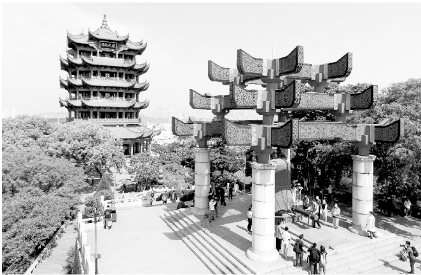
黄鹤楼重新开放 4月29日拍摄的武汉黄鹤楼景区(无人机照片)。当日,武汉黄鹤楼景区重新开放。目前,景区不提供窗口售票,游客通过网络实名预约购票。黄鹤楼主楼部分开放,每半小时允许300名游客进入。

“最近,国家还陆续出台了扩大汽车消费、延续实施普惠金融和西部大开发优惠等税收政策,多措并举帮助各类市场主体尤其是中小微企业渡过难关。”蔡自力说。 蔡自力说,新冠肺炎疫情发生以来,党中央、国务院先后部署出台多批税费优惠政策,聚焦支持疫情防控工作,聚焦减轻企业社保费负担,聚焦支持小微企业和个体工商户发展,聚焦稳外贸扩内需。 据介绍,受上述减税降费政策减收和疫情带来税基减少等因素的影响,今年一季度,全国税务部门组织的税收收入完成34826亿元(已扣出口退税),同比下降16.4%。