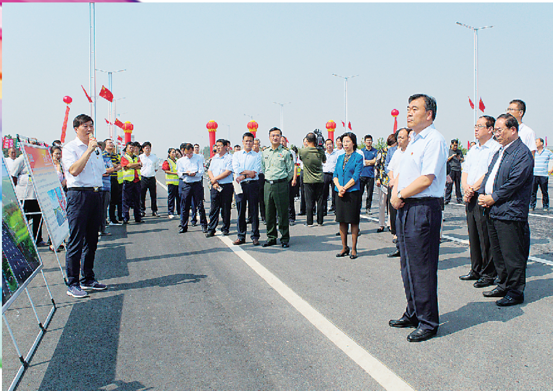
市委书记刘继栋在公路工程一线检查指导工作。