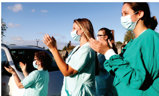
让悠扬的乐曲表达崇高的敬意

5月12日,葡萄牙首都里斯本的圣玛利亚医院的医护人员为“法朵”音乐表演团队“月光小夜曲”成员表演的“法朵”乐曲鼓掌。当天是国际护士节,乐队成员专程到医院,送上葡萄牙最具民族特色的音乐——“法朵”乐曲表演,表达对医护人员的敬意。