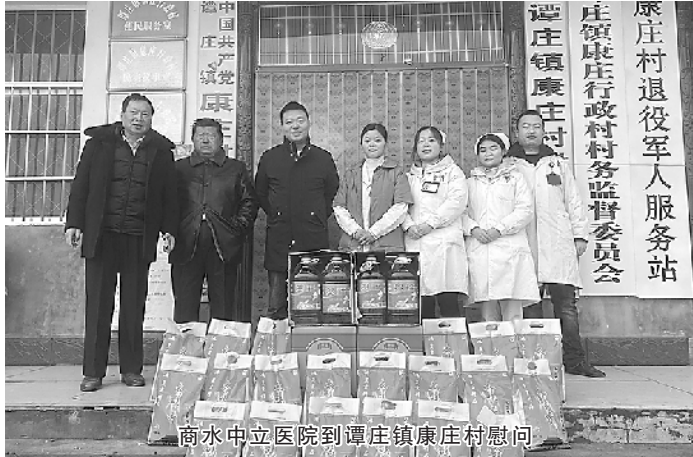
商水中立医院到谭庄镇康庄村慰问