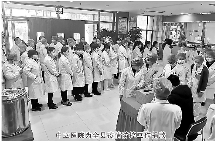
中立医院为全县疫情防控工作捐款