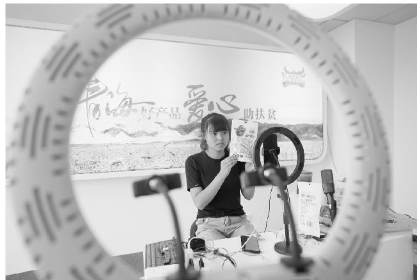
“青品汇”助力青海消费扶贫 8月4日，工作人员在“青品汇”全国消费扶贫青海众创基地直播销售。近日，全国消费扶贫青海众创基地以“政府搭台、企业唱戏、市场化运营”的形式打造“青品汇”电商平台，将青海省的高原特色产品免费引入平台，用消费驱动增长，落实消费扶贫，推动青海39个贫困县、200多家高原特色农产品企业高质量发展。