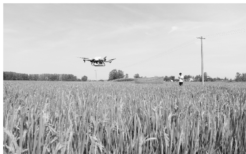
安徽肥东：恢复生产 灾后自救 8月4日，在肥东县店埠镇，农业科技公司的技术人员杨汉林操作无人机喷洒农药。受汛情影响，安徽省肥东县部分乡镇发生洪涝灾害，农业生产受到影响。为降低损失，当地乡镇在积极防汛的同时开展生产自救。

气象部门预测，“黑格比”登陆后，将逐渐向偏北方向移动穿过浙江，强度逐渐减弱，预计将于4日夜里离开浙江，于5日白天从江苏北部移入黄海西部，以后转向东北方向移动。