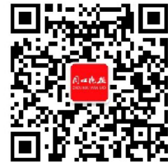
周口晚报微信公众号