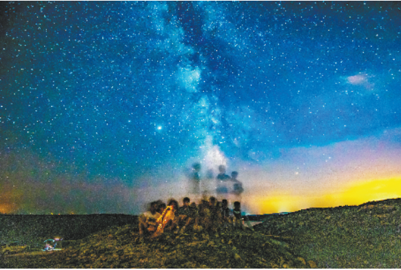
一起去看流星雨 8月12日晚,人们在克罗地亚伊斯特拉省观看英仙座流星雨(长时间曝光照片)。