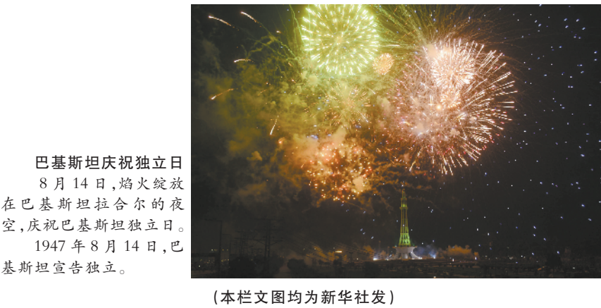
巴基斯坦庆祝独立日 8月14日,焰火绽放,在巴基斯坦拉合尔的夜空,庆祝巴基斯坦独立日。1947年8月14日,巴基斯坦宣告独立。 (本栏文图均为新华社发)