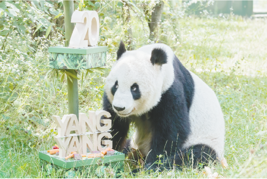
大熊猫“阳阳”庆祝生日 8月9日,在奥地利维也纳美泉宫动物园内,大熊猫“阳阳”准备享用生日礼物。近日,奥地利维也纳美泉宫动物园为生活于此的大熊猫“阳阳”庆祝20岁生日。“阳阳”自2003年来到维也纳美泉宫动物园以来,一直是这里的“明星”,深受人们喜爱。