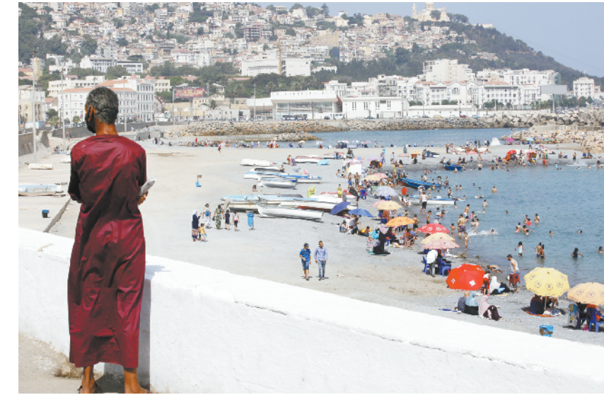
阿尔及利亚重新开放海滩 8月15日,阿尔及利亚民众在首都阿尔及尔的一处海滩休闲。阿尔及利亚政府从15日起调整防疫封禁措施,重新开放自3月中旬起关闭的海滩。

哈姆杜克与马德布利在会谈后举行的联合新闻发布会上表示,苏丹和埃及致力于加强两国在各领域的合作。马德布利说,埃及支持苏丹国内的稳定与安全。