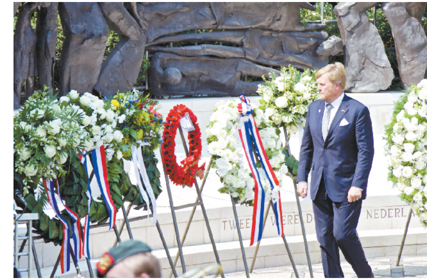
荷兰举行仪式纪念日本投降75周年 8月15日,荷兰国王威廉-亚历山大在海牙出席二战日本投降75周年纪念仪式。1945年8月15日,日本宣布无条件投降。

普京14日发表声明说,安理会内部围绕伊朗问题的讨论日趋紧张,伊朗受到无端指责,安理会决议恐遭破坏。俄方建议尽快在线召开有德国和伊朗参加的联合国安理会五常峰会。