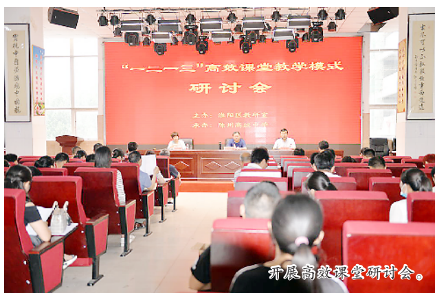
开展高效课堂研讨会。