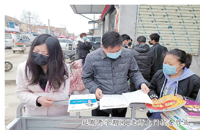
延期开学期间,老师上门检查作业。