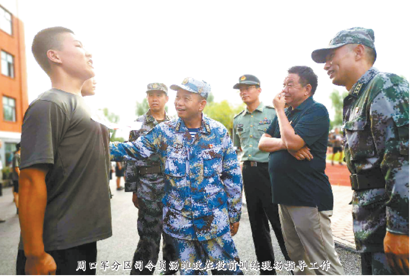
周口市军分区司令员汤维政在役前训练现场指导工作。