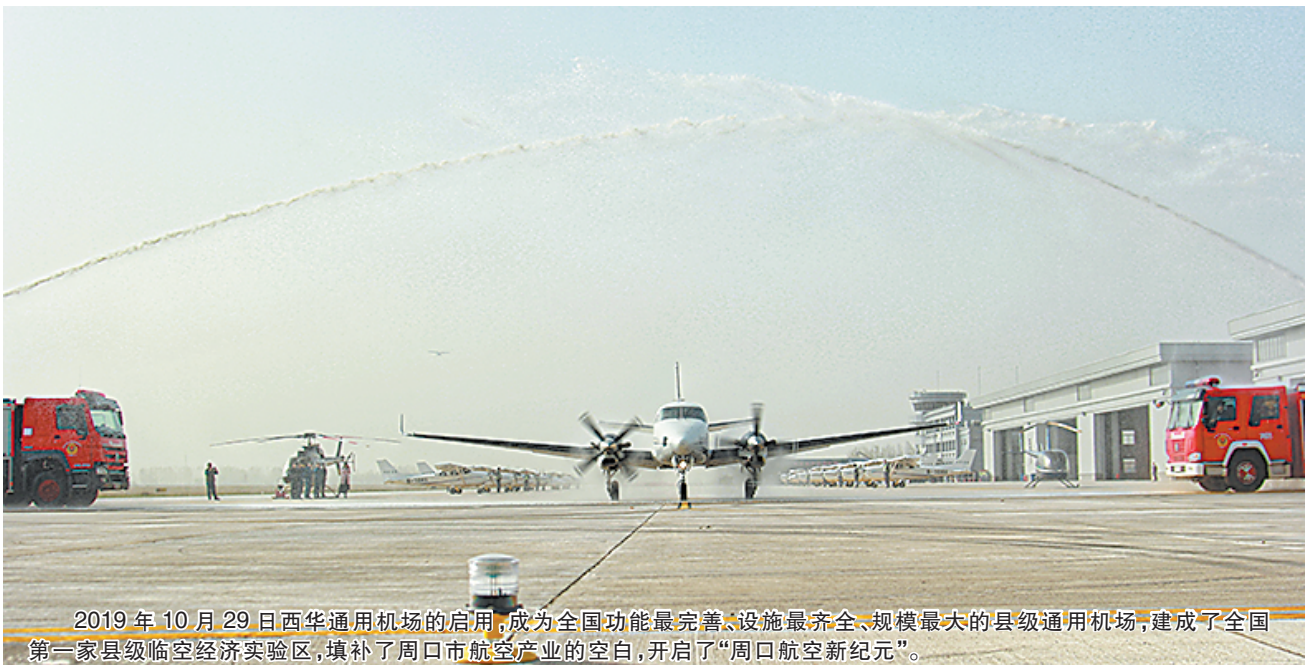
2019年10月29日西华通用机场的启用,成为全国功能最完善、设施最齐全、规模最大的县级通用机场,建成了全国第一家县级临空经济实验区,填补了周口市航空产业的空白,开启了“周口航空新纪元”。