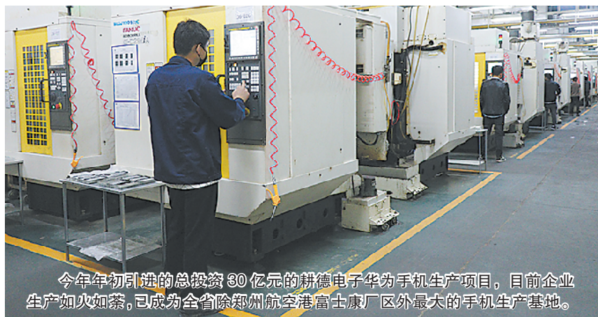
今年年初引进的总投资30亿元的耕德电子华为手机生产项目,目前企业生产如火如荼,已成为全省除郑州航空港富士康厂区外最大的手机生产基地。