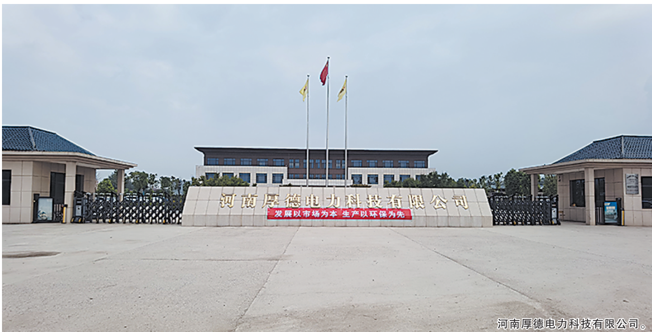
河南厚德电力科技有限公司。