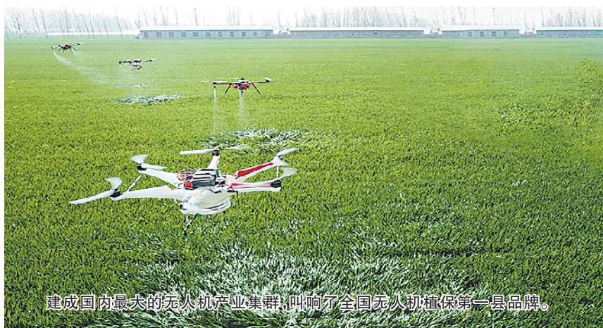
建成国内最大的无人机产业集群,唱响全国无人机维保第一县品牌。