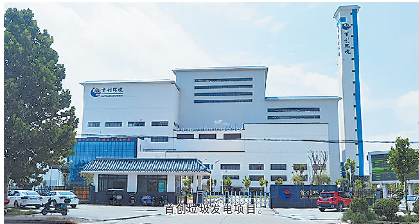
首创垃圾发电项目。