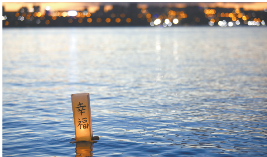
巴西:放水灯悼念新冠逝者 这是 11 月 30 日在巴西首都巴西利亚拍摄的湖上的水灯。11 月 30 日傍晚,巴西首都巴西利亚的居民往帕拉诺阿湖中放入 300 个水灯,以悼念在新冠疫情中病逝的人们。该水灯仪式的影像将在当地 12 月 5 日至 6 日在线上举行的日本节上放映。

度及津中双方工作团队的配合 感到非常满意,并对施工方努 力克服新冠疫情疫情影响、积 极复产复工表示钦佩。 津巴布韦新议会大厦是中国 在南部非洲最大的援建项目。 项目位于津巴布韦首都哈拉 雷市区以西 20 公里的汉普 登山新城,总建筑面积 3.3 万 平方米,建成后将成为当地的 地标性建筑。