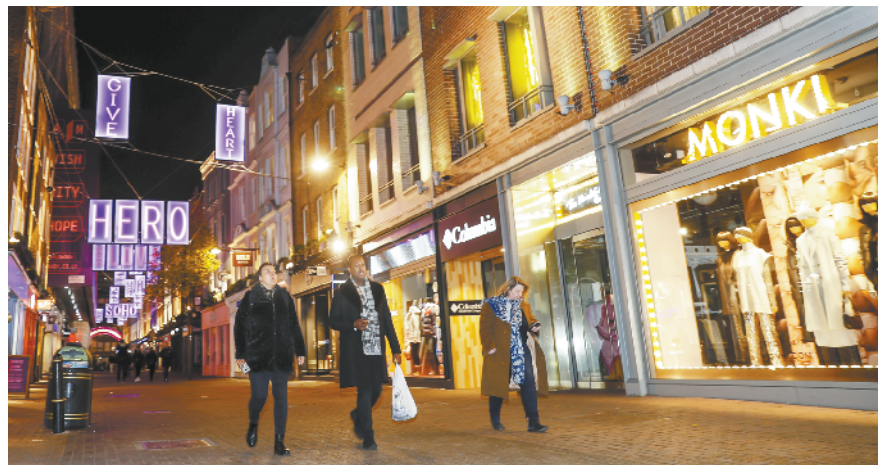
疫情下的伦敦:点亮彩灯 点亮希望 11 月 30 日,人们在英国伦敦市中心点亮彩灯的卡纳比街上行走。为应对新冠疫情,英国英格兰地区仍在实施大范围“禁足”措施,要求民众除上学、购买生活必需品等特别原因外,尽可能留在家中。但随着圣诞节和新年的临近,伦敦市中心点亮的彩灯依然给这座城市带来了节日气氛,向人们传递温暖和希望。

家医疗物资储备中心将用来储备 口罩等防护装备以及呼吸机和药 品等,2021 年年底前将主要储备 已采购的医疗物资,之后其中的 进口产品都将替换为德国国产 品。 公报还介绍,联邦政府将拨款 10 亿欧元用于建设国家医疗物资储 备中心。按计划,这些储备中心最 多可储备满足全国半年所需的医 疗物资,实际使用时至少可储备 可供全国使用 1 个月的医疗物 资。