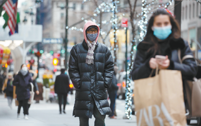
美国新冠确诊病例超 2100 万例

复苏, 坚决维护国家和平稳定。他鼓励全体议员走上街头, 多倾听人民心声, 了解群众需求, 并以此为基础来修改和制定法律。 委内瑞拉去年 12 月 6 日举行议会选举, 执政党竞选联盟赢得选举胜利, 获得议会 277 个席位中的 253 个。新一届议会任期从 2021 年至 2026 年。 委反对派联盟在 2015 年议会选举中赢得多数席位, 但因涉嫌舞弊等一系列违规操作, 上届议会一直被委最高法院裁定处于“非法状态”, 未正常行使立法权。自 2017 年至 2020 年 12 月 31 日, 立法权由委制宪大会行使。