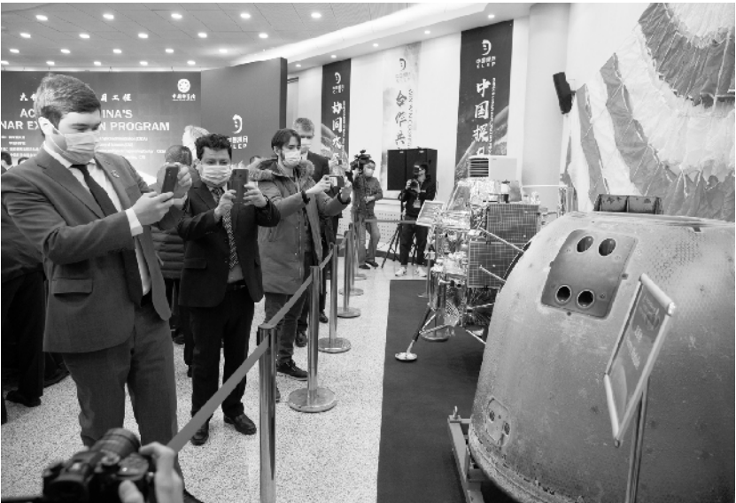
大使走进中国探月工程

1月18日,外国驻华使馆及国际组织人员在中科院国家天文台参观嫦娥五号任务航天器模型和实物。