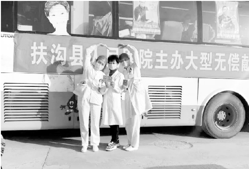
近日,为保障临床用血,扶沟县人民医院开展以“爱心暖寒冬、热血伴爱行”为主题的大型献血活动,该院职工积极加入到无偿献血的队伍中,彰显了扶沟县医院人热心公益、医者仁心的高尚情怀。