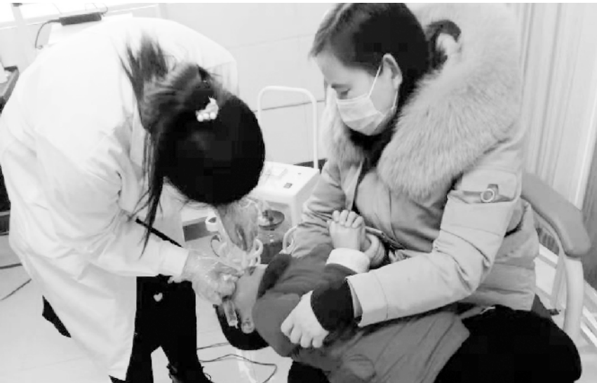
一直以来,太康县妇幼保健院秉承公益办院理念,坚持以患者为中心的服务原则,全院医务人员用爱心、耐心、责任心对待每一位患者,受到广大患者的一致好评。图为该院耳鼻喉科医生为患者治疗。 记者 史书杰 摄

近日,为保障临床用血,扶沟县人民医院开展以“爱心暖寒冬、热血伴爱行”为主题的大型献血活动,该院职工积极加入到无偿献血的队伍中,彰显了扶沟县医院人热心公益、医者仁心的高尚情怀。 记者 史书杰 摄