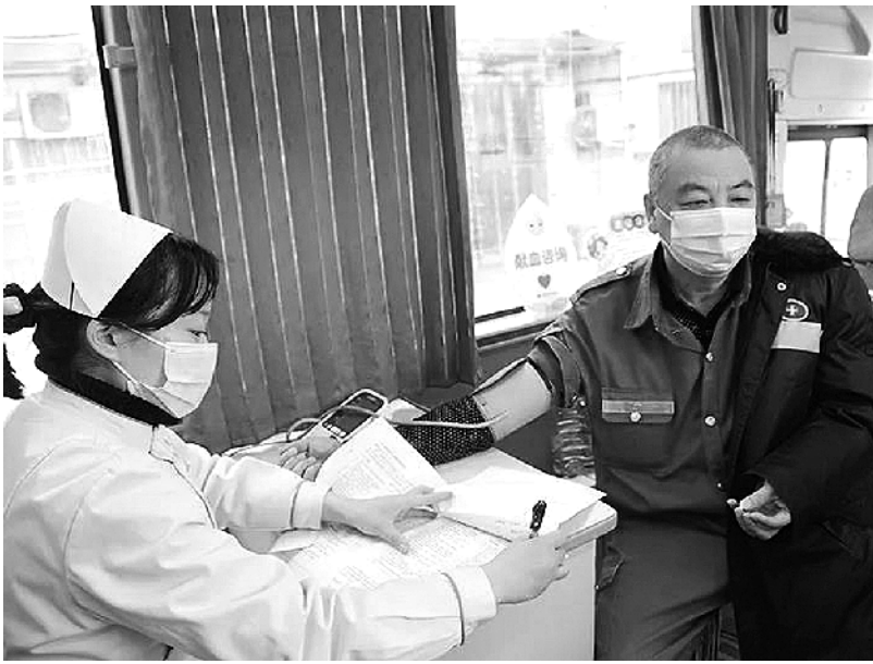
近日,郸城县第二人民医院开展无偿献血活动。该院职工踊跃参与,用行动诠释医务人员的爱心和社会责任。据统计,当天约 130 余人成功献血。