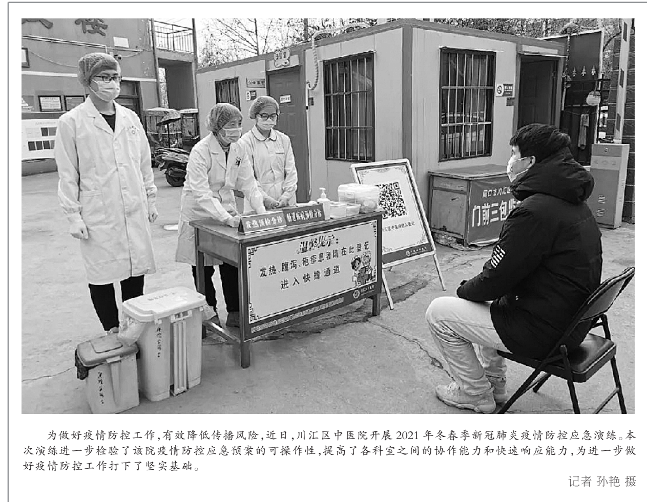
为做好疫情防控工作,有效降低传播风险,近日,川汇区中医院开展 2021 年冬春季新冠肺炎疫情防控应急演练。本次演练进一步检验了该院疫情防控应急预案的可操作性,提高了各科室之间的协作能力和快速响应能力,为进一步做好疫情防控工作打下了坚实基础。

川汇区荷花社区卫生服务中心 数字化预防接种门诊投入使用 本报讯 (记者 史书杰)为进一步优化预防接种服务流程,为群众提供更加优质、便捷的预防接种服务,近日,川汇区荷花社区卫生服务中心数字化预防接种门诊正式投入使用。 据了解,该中心数字化预防接种门诊以信息化系统为基础,将儿童预防接种信息与预检、候诊、登记、接种、留观等接种流程融为一体,通过 LED 显示屏、电脑显示屏实时展示接种、候种、排队及留观儿童信息,速度快、效率高,大大提高了接种的安全性。群众可以下载小豆苗 APP 提前预约下次接种时间和疫苗类型。 该中心数字化预防接种门诊不仅使群众在疫情防控常态化下实现了安全有序候诊,还为儿童及家长创造了一个温馨、舒适、安全的接种环境,标志着该中心在提升公共卫生服务质量方面又上了一个新台阶。