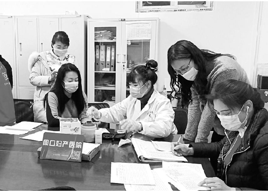
近日,川汇区“关爱女性 呵护身心”健康公益活动启动仪式在川汇区交通运输局举行。图为周口妇产医院志愿者为川汇区交通运输局女职工体检。

处置能力。 演练结束后,该院召开总结反馈会,各科室分别就演练中发现的问题进行了反馈。 本次演练提高了该院医务人员的应急处置能力,发现了工作中存在的问题,筑牢了人民群众生命健康安全防线。