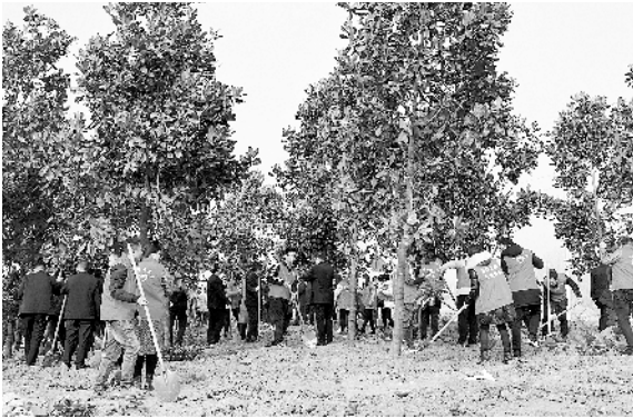
商水县义务植树活动现场。

草长莺飞,春回大地。3月12日,在第43个植树节之际,全市掀起义务植树热潮,党员干部、志愿者、市民踊跃参与义务植树活动。扶正树苗、挥锹培土、分层踩实、堆起围堰、提水浇灌,认真地完成着每一道工序,栽下了一棵棵树苗,为改善生态环境、绿化美丽家园种下了一棵棵绿色的希望。本报采撷了几个镜头以飨读者。