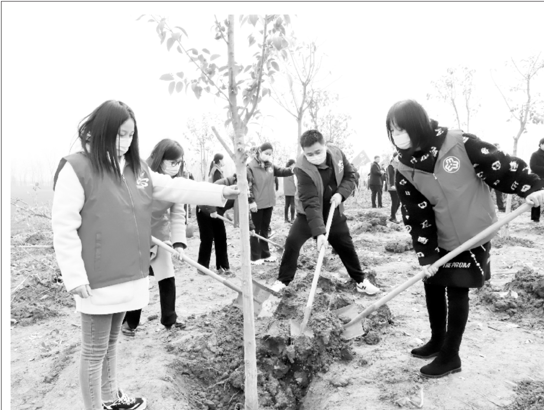
郸城县义务植树现场。

以史为鉴,可以知兴替。请关注本报周一刊发的《平粮台古城:中国最早的方正之城(下)》,随着文字一起穿越到4000多年前的平粮台古城,共同触摸当时古人的生活足迹,聆听早已远去的战鼓声。②10