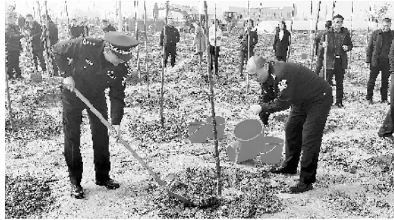
开发区干部职工义务植树添新绿。