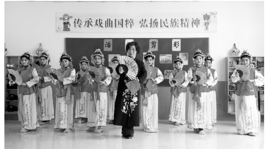
河北隆尧:传承京剧艺术 弘扬传统文化

4月12日,在那台市隆尧县第三实验小学京剧课堂,戏曲老师指导学生练习京剧表演基本功。