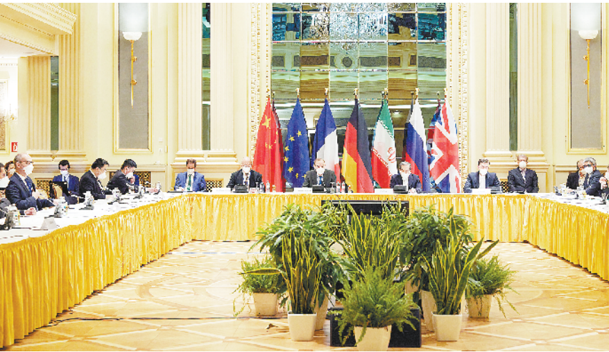
伊朗核问题全面协议联合委员会新一轮政治总司长级会议在维也纳举行 这是 4 月 15 日在奥地利维也纳拍摄的伊朗核问题全面协议联合委员会新一轮政治总司长级会议现场。 伊朗核问题全面协议联合委员会新一轮政治总司长级会议 15 日在维也纳举行，继续讨论美伊恢复履约问题