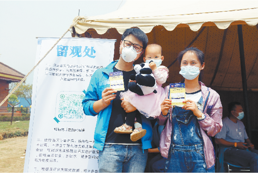
“春苗行动”在尼泊尔正式启动 4 月 15 日，一对父母在尼泊尔加德满都的尼武警医院接种中国产新冠疫苗后合影。 为海外中国公民接种新冠疫苗的“春苗行动”15 日在位于尼泊尔首都加德满都的尼武警医院正式启动。

新华社华盛顿 4 月 15 日电 （记者刘品然）在美国对俄罗斯实施大规模制裁并驱逐 10 名俄外交人员后，美国总统拜登 15 日说，美俄两国应缓和局势，他已提议与俄总统普京今年夏天在欧洲举行峰会。 拜登当天下午在白宫就美俄关系问题发表简短讲话。拜登说，他 13 日与普京通话时说，美方本可以对俄实施更大规模的制裁，但他选择了“适度”措施。 拜登说，美方不寻求与俄罗斯开启局势紧张升级和冲突的循环，希望实现稳定、可预见的双边关系。但如果俄方继续干预美国民主，美方将采取进一步行动。 拜登说，现在是缓和局势的时候，未来应通过对话和外交手段处理美俄关系，美方准备在此过程中发挥建设性作用。 拜登说，他已向普京提议今夏在欧