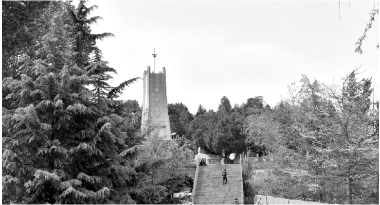
2021 年 4 月,游客游览位于赤岸村将军岭上仍在使用的“将军渠”。