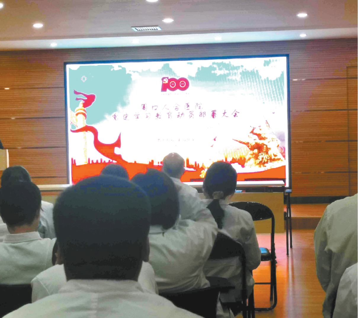
周口人合医院召开党史学习教育动员会

本报讯(记者 梁照曾 文/图)4月20日下午,周口人合医院召集全院各科室中层以上党员干部及医务人员召开党史学习教育动员会(如图),引导党员干部学史明理、学史增信、学史崇德、学史力行,做到学党史、悟思想、办实事、开新局,奋力推动周口人合医院事业高质量发展。 周口人合医院领导班子全体成员参加动员会,并听取医院党支部举办的“不忘初心 牢记使命”的专题讲