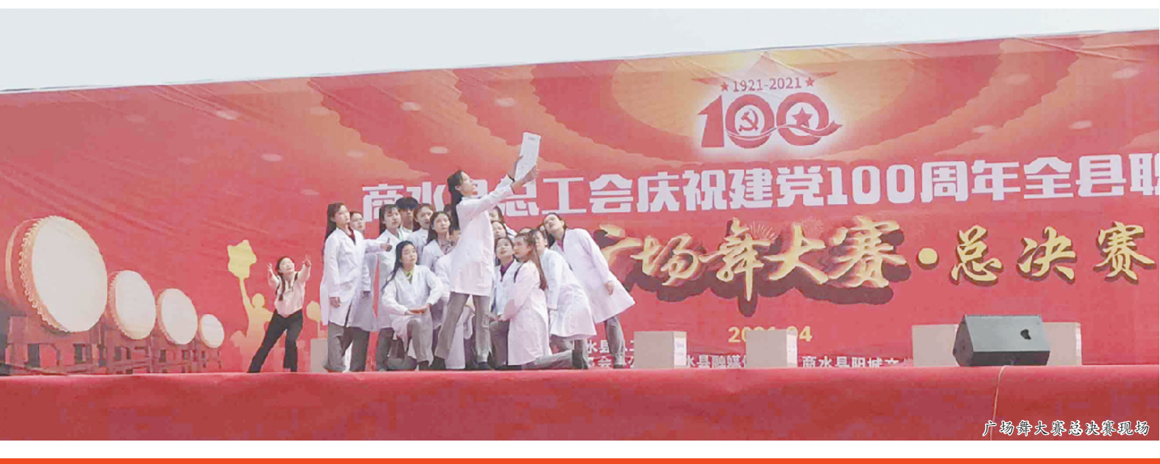
广场舞大赛总决赛现场

基层工会主席和广大干部职工群众8000多人到现场观看比赛。本届比赛共有486支队伍参赛,周口人合医院代表队表演的广场舞《逆行者》荣获一等奖。 商水县举办的此届广场舞大赛规模超前,全县共有486支代表队、7600多名队员参赛,通过选拔赛、预赛,职工群众参与的积极性空前高涨,参赛队数、参赛队员之多达历年最高。本次比赛设县直组、乡镇组和教育组三个组,经过15天的选拔赛和预赛共有38支代表队进入决赛。最后的决赛现场在油菜花飘香的沙颍河畔的张湾村举行,让热烈激情的比赛更多一些诗意和唯美情感,选手们精神百倍。周口人合医院广场舞代表队是有34名医务人员组成,他们是2020年抗击新冠肺炎疫情的参与者和经历者,是逆行的白衣天使,用大爱和大无畏牺牲精神,展示