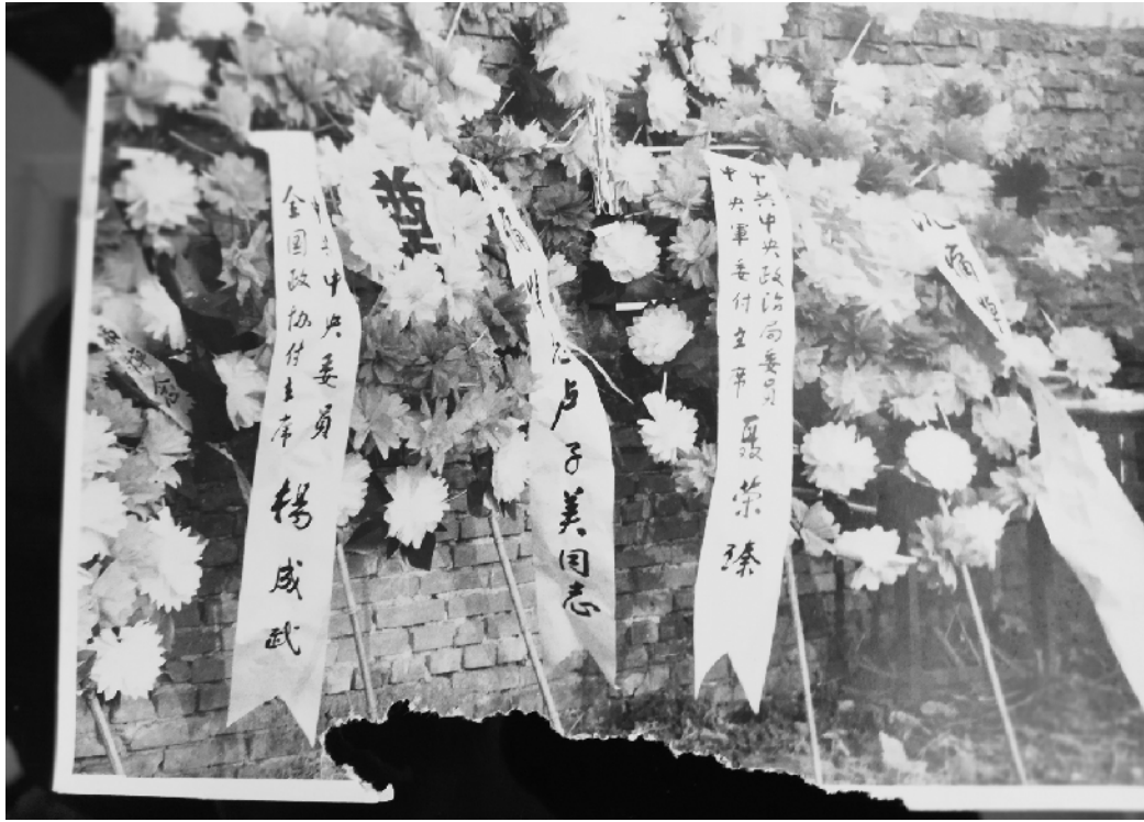
卢子美去世后，聂荣臻、杨成武、肖华等党和国家领导人送来花圈。