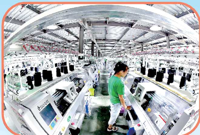
“鹿邑织造”蓬勃发展