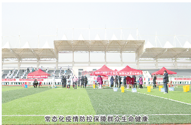
常态化疫情防控保障群众生命健康