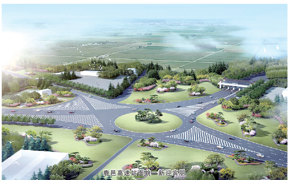
鹿邑商建站面貌一新迎宾客