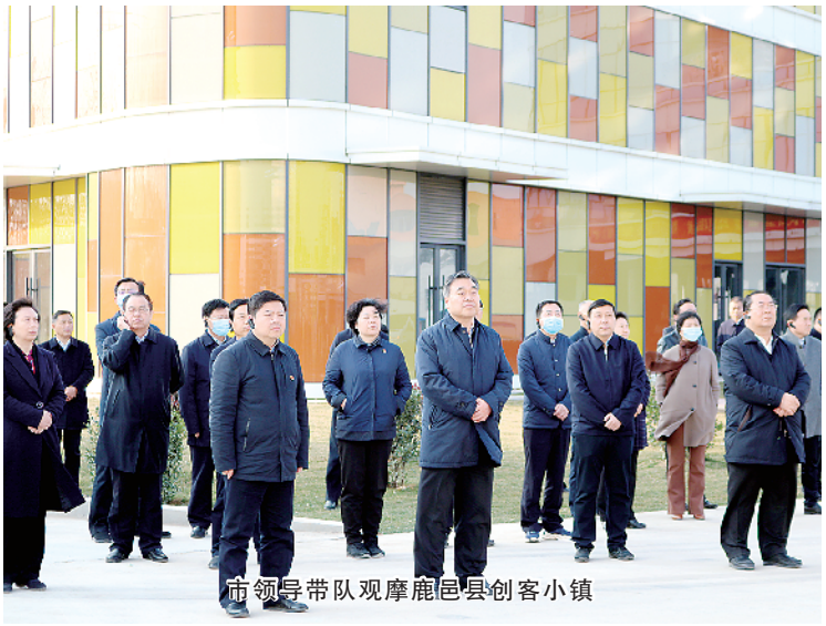
市领导带队观摩鹿邑县创客小镇