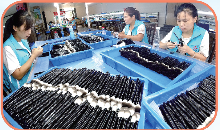
鹿邑化妆刷畅销全球