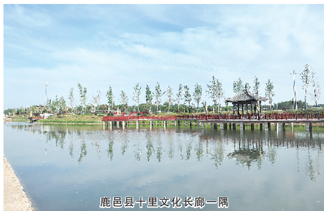
鹿邑县十里文化长廊一隅