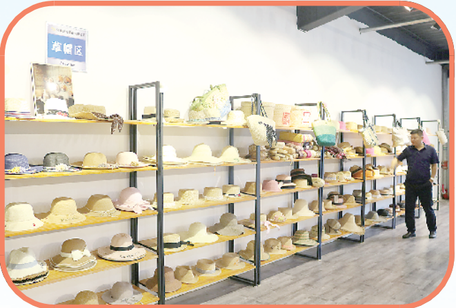
鹿邑草编走向世界