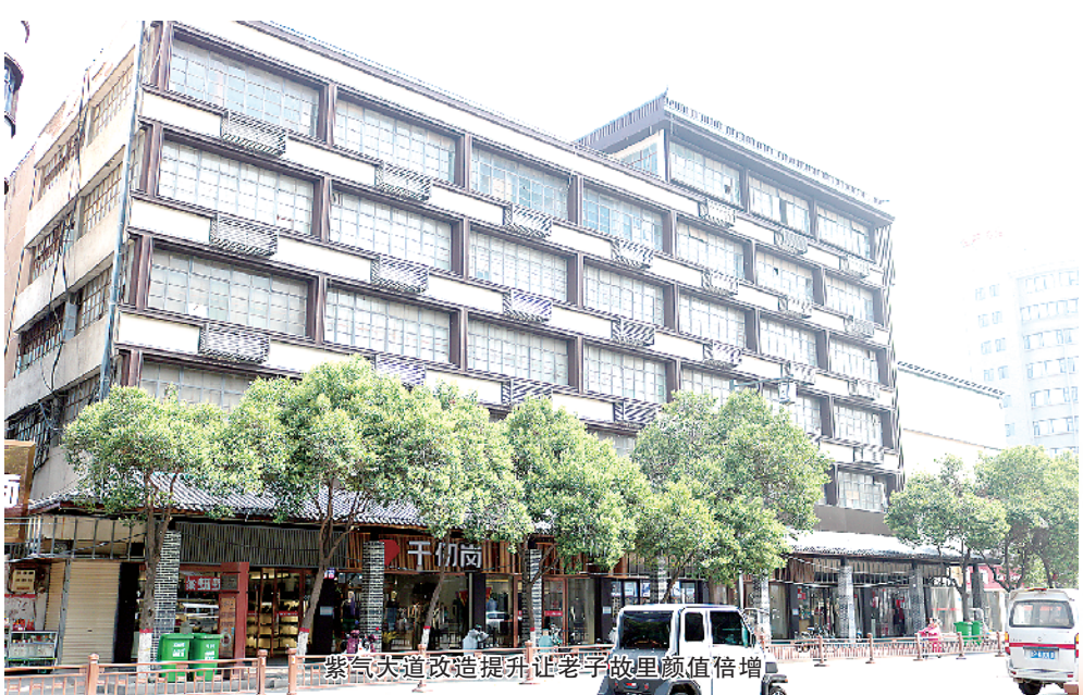
紧盯交通改造提升让老百姓出行更便捷