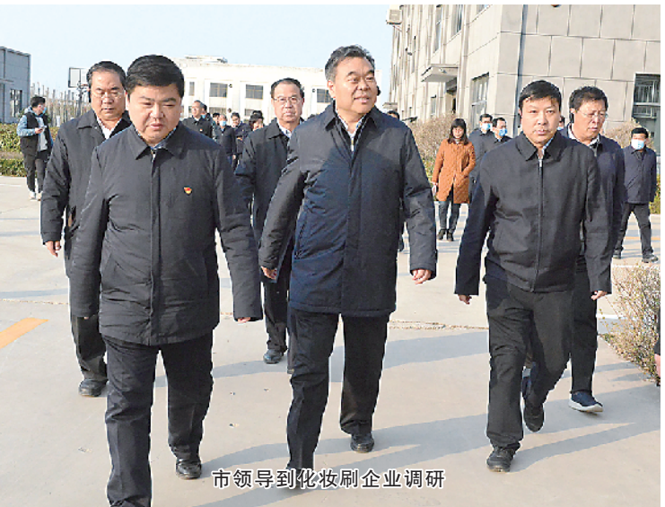
市领导到北汝刷企业调研