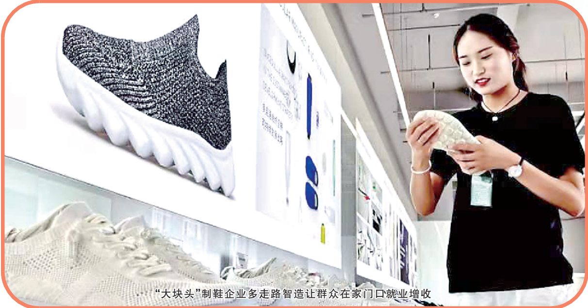
“大钱头”制鞋企业多走路智造让群众在家门口就业增收