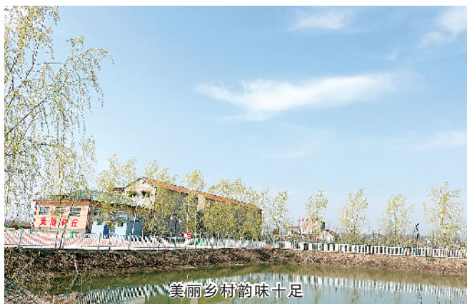
董园乡村前味十足